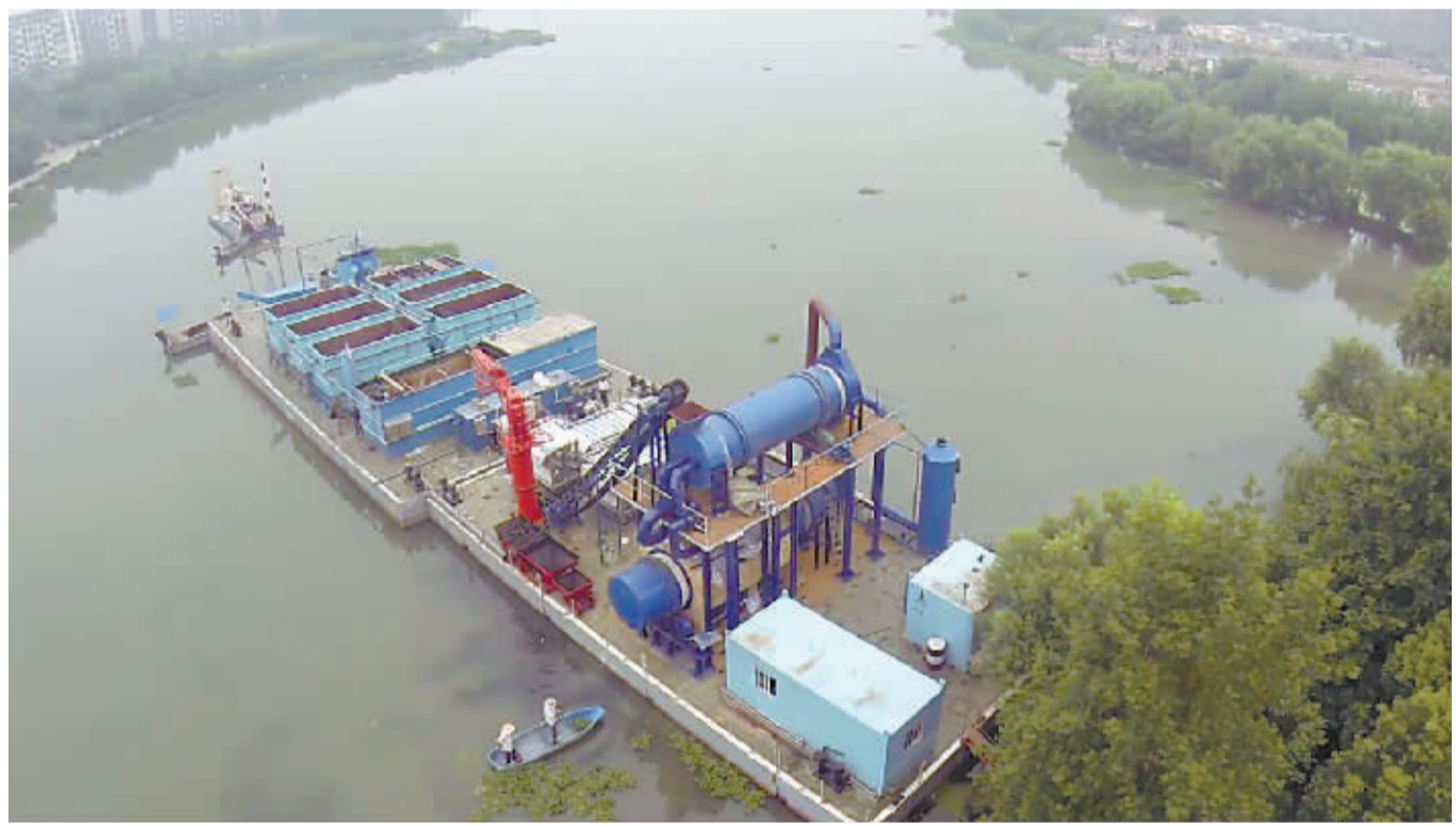
昨日,水上可拆卸式清淤工厂在汉阳区墨水湖试运行,它的形状像一座海上钻井平台

据了解,墨水湖计划清淤50万立方米,此次试点水面一体化清淤10万立方米,预计将在两个月左右完成。