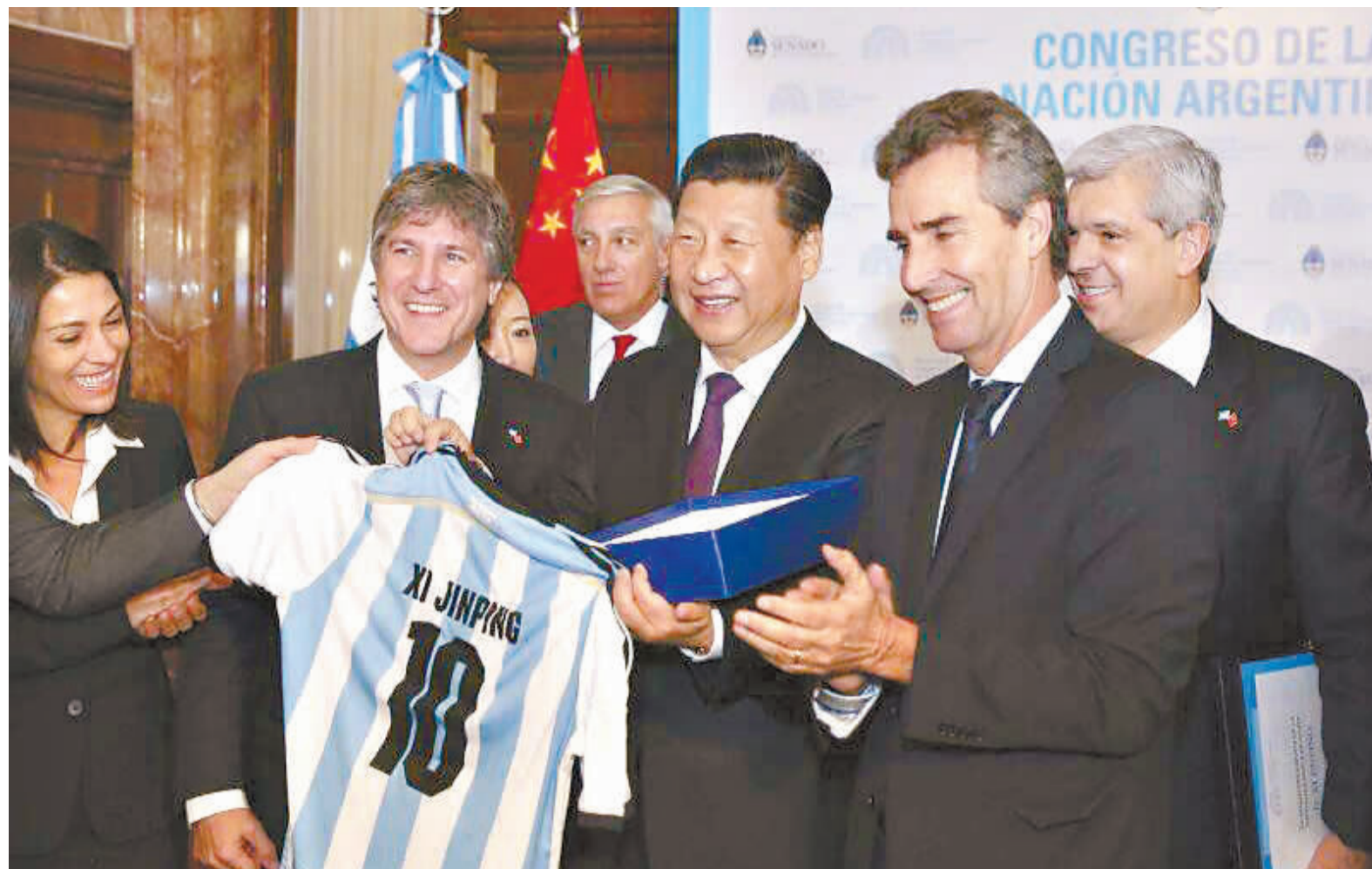
19日阿根廷副总统兼参议长布杜(左二)向习近平主席赠送阿根廷国家队10号球衣