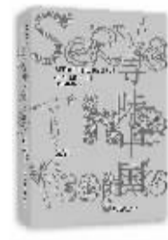
《寻味中国》 [美]林留清怡 著 胡韵涵 译 重庆大学出版社

林留清怡在美国出生长大,父母来自中国台湾。2000年,哥伦比亚大学新闻学硕士学位的她首次来到中国,中国丰富的美食文化,引起了她的极大兴趣。之后,她往返于北京、上海、成都,学习烹饪,开始了自己“舌尖上的中国”之旅。