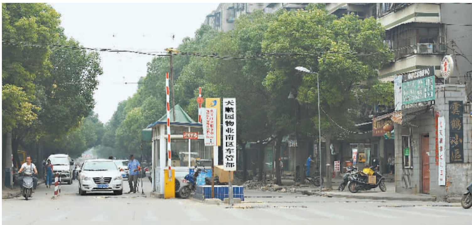
天顺园物业公司在小区外城市道路上圈地设卡,对过往车辆收费