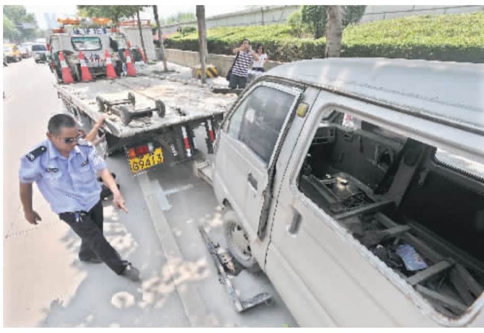
昨日,汉口大队交警在沿河大道路边拖离一辆停放1年以上的面包车

保有量开始大幅增长,14年过去,许多车已经临近报废年限。目前,被遗弃在路上的有一半是购买价较为便宜的面包车。警方将进一步进行排查,也欢迎市民进行举报。 补贴取消,车主“没动力”处理临检报废车 为何把车一丢了之?交管部门找到了部分“僵尸车”车主,得到的答案大多是:处理太麻烦。 1997年以来,私家车使用年限一放宽,今年“五一”彻底取消了私家车到达年限强制报废的规定。其中一些车辆一再逾期不参加检测,没买保险,有的已被注销号牌,流落街头成为僵尸车。2011年,国家取消了对车辆报废的3000元至万余元的补贴,一些车主对于申请报废车辆失去积极性,加上不知道到哪里申请报废,任由旧车成为僵尸车。 不少车主表示,“去卖废铁也卖不了几个钱,上面还有电子眼,办手续太麻烦了。”据交管人士介绍,车辆申请报废并不难,处理完交通违法行为记录后,只需通知报废汽车回收企业,对方可协助办理全套注销手续。 交警人士提醒:如果交管部门通过僵尸车的牌照、发动机和车架号信息等找到了车主,车主仍旧躲不过交通违章的处罚,逾期还将收取滞纳金。