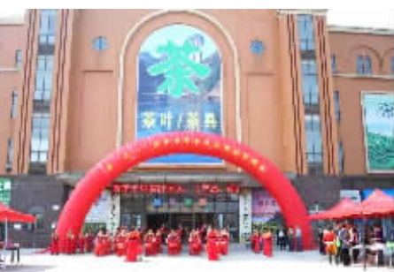
茶业市场促销现场

一座新城在汉口北建立起来。四季美农贸城雄踞汉口北市场群,重塑了武汉农贸市场新格局。