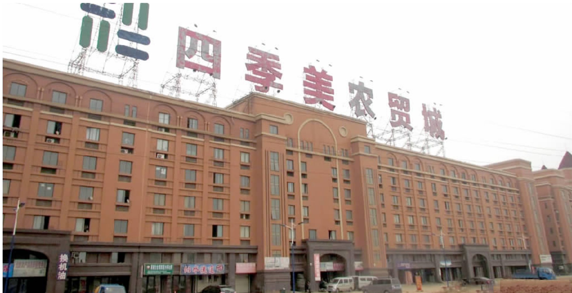
惠商丰华四季美农贸城