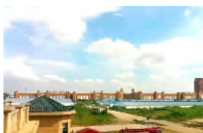
惠商丰华四季美农贸城全貌

古语有言“岁不寒,无以知松柏;事不难,无以知君子。”暴雨期间,洪灾泛滥,对于惠商丰华四季美农贸城来说仍然是一个挑战。水灾面前,惠商丰华四季美农贸城运筹帷幄,外菜内调创下高峰;彰显人文关怀,正能量引导商户让利优惠,惠商丰华四季美农贸城在大灾面前尽显其美。