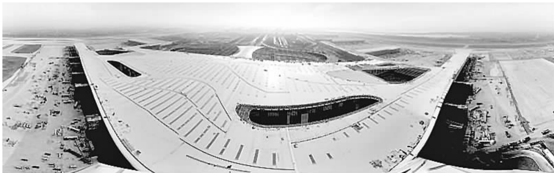
T3航站楼全景