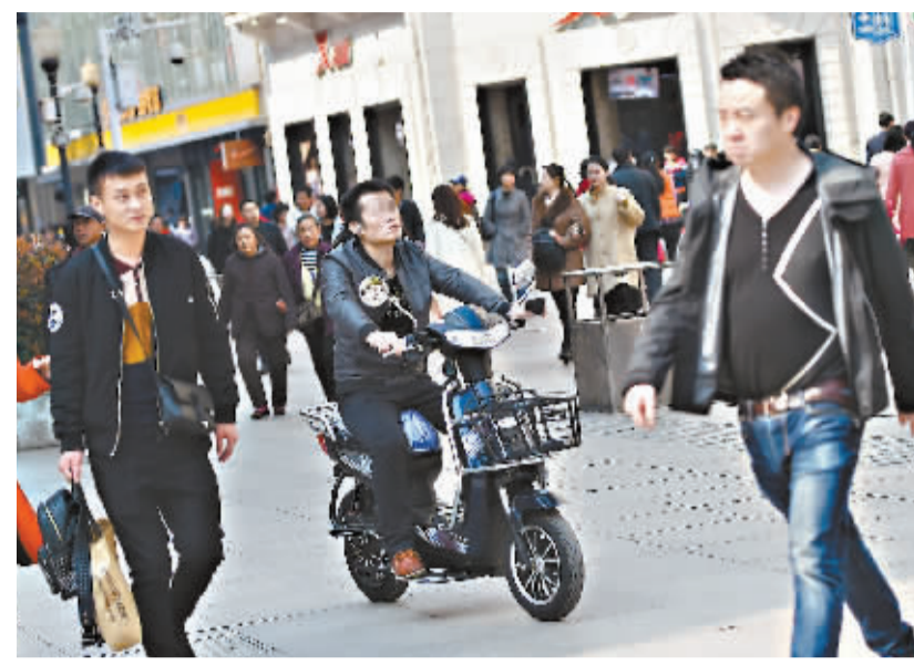
穿行在江汉路步行街上的电动车

这位负责人强调，江汉路管理办公室是市城管委下属的二级单位，对电动车没有处罚权，只能是劝阻；除