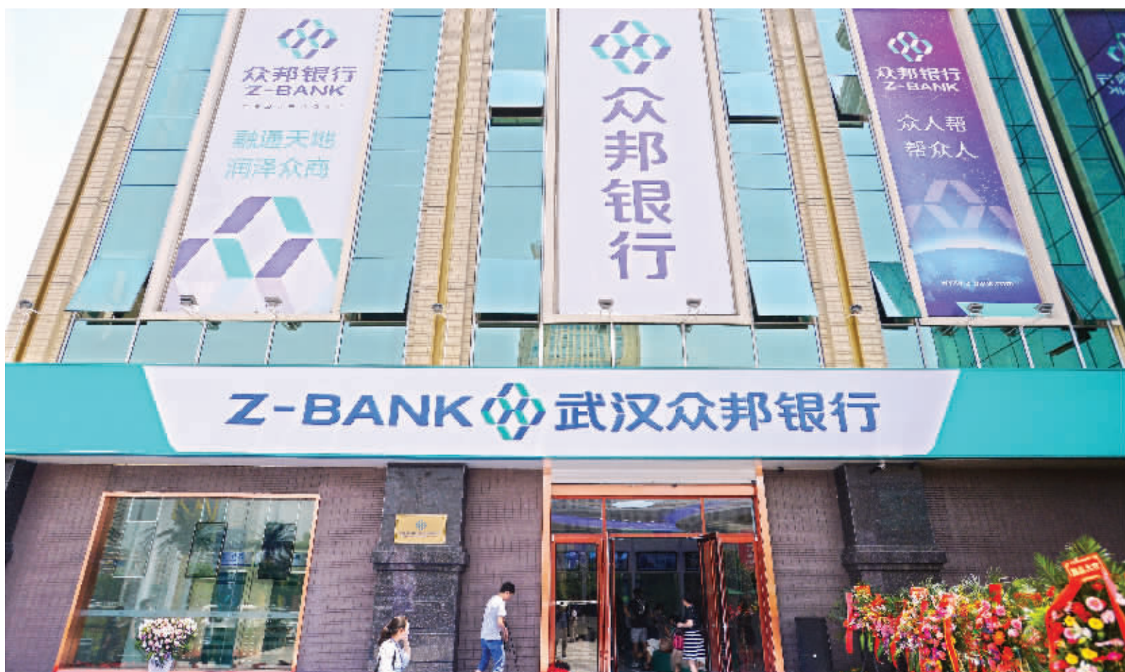
昨日,位于汉口北的武汉众邦银行体验店正式对外营业