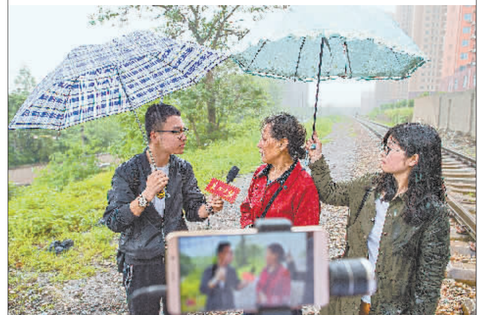
有网民在“武汉城市留言板”反映,汉阳港埠铁路专用线周边居民出行难。5月3日,汉阳区多个部门现场办公,承诺年内开建下穿通道,通道建好前,设临时通道方便居民出行。图为本报直播现场办公时采访附近居民