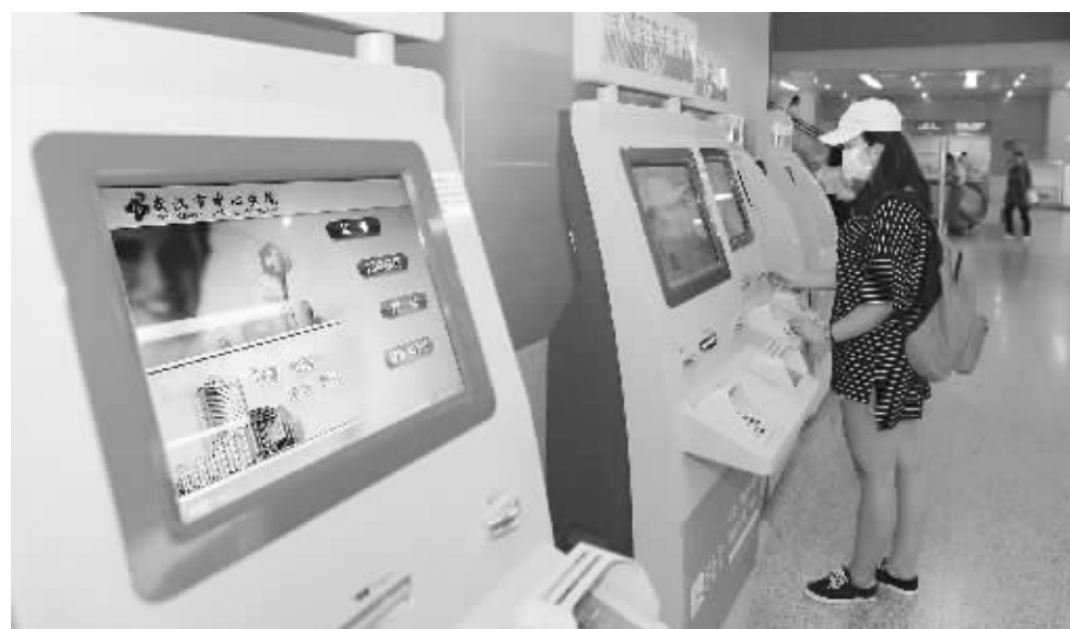
18日,市民在武汉市中心医院使用健康卡就医,挂号、缴费十分便捷