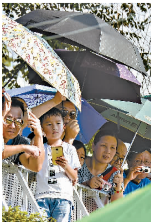
抢渡登陆点,众多市民围观