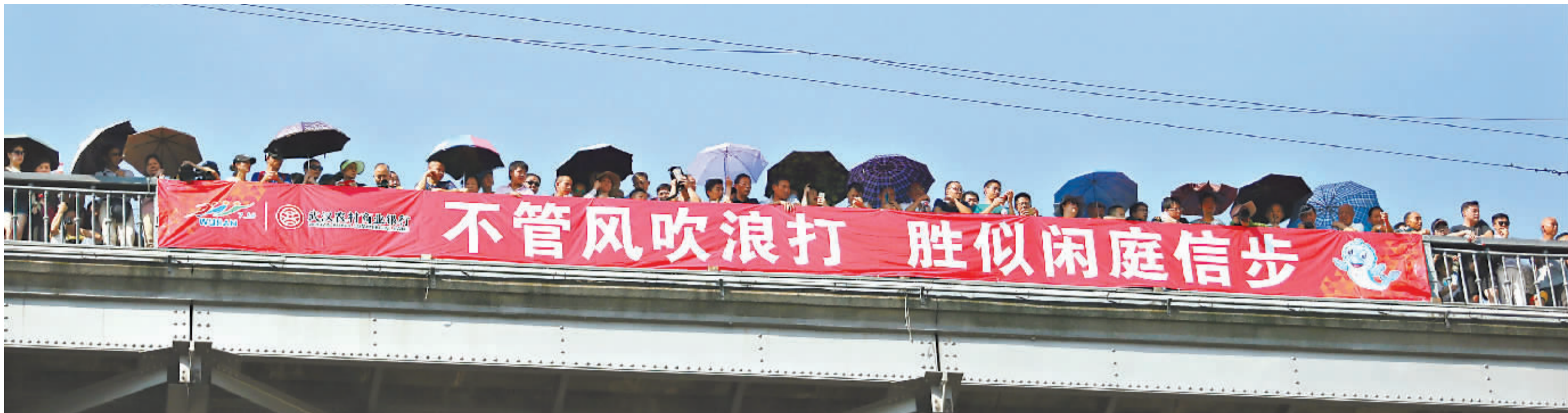
2017年7月16日,人们在长江大桥上观看选手们横渡长江