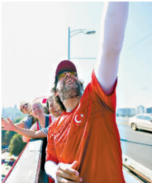
在大桥上观看比赛的外国朋友一起合影

并没有特别叮嘱什么。“所以得知妈妈要渡江,我也是全力支持。会有点担心她的安全,但我更希望她健康、开心。何况渡江节的安全措施很到位,不用我操心什么。”爱旅游、爱潜水的兰薰在世界各地都看到过白发苍苍还在自驾、搏击江河湖海的老人,“运动对身体健康的作用显而易见,我也希望我的妈妈和他们一样。” 上午11时,方队的成员们陆续横渡成功,出现在起水点的展板处,兰薰到处搜寻母亲的身影。“妈妈,妈妈!”已经换好衣服的徐丽娟也看到了女儿,连忙跑了出来。第一次成功渡江,看得出徐丽娟非常兴奋,拉着女儿说个不停,“今天真的是天公作美,很轻松就游过来了,感觉一直在顺水漂,一点都不累。”徐丽娟还说起下水前的小插曲,“可能太紧张了,我一直不停上厕所,队长都劝我不要游了,上船算了。”徐丽娟忙向领队“求情”,最后如愿下水,“下了水就不怕了”。她和团队一起,保持整齐的队形成功渡江。 兰薰今年工作较忙,前段时间一直出差,没能参与训练,这次只能遗憾地错过。母女俩约定,有机会一定要一起渡一次江。