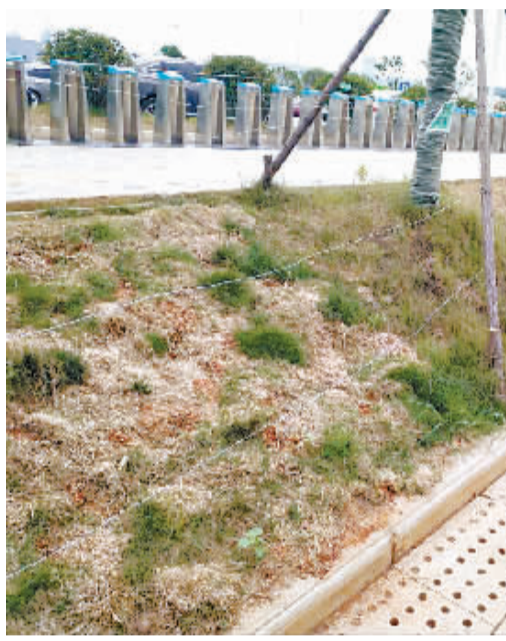
被踩踏坏的绿化带已修复

网民:由江城大道公交站到江城大道地铁站(B、C两个出口)之间有一条绿化带,因未铺设专用道路,行人只能从绿化带踏过,且绿化带中间有一道2米左右的坑洼(未铺草皮或地砖),一到下雨天就有大量泥水淤积,这些问题不仅影响市容市貌,也给广大市民出行带来极大不便甚至是安全隐患。望有关部门核实后,尽快整改。