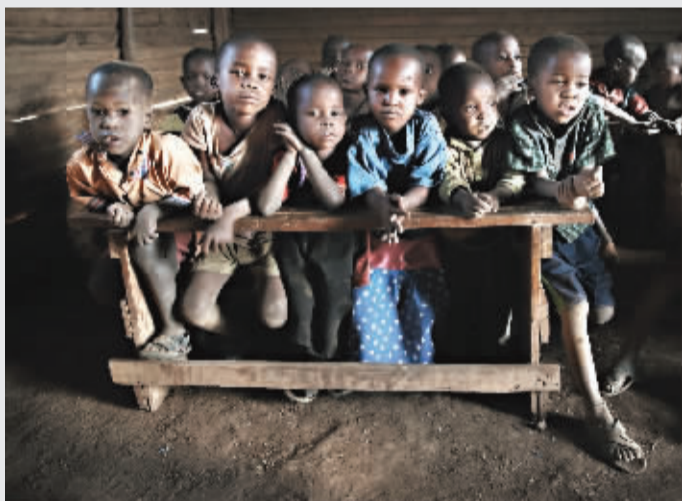
课堂上的马赛孩童