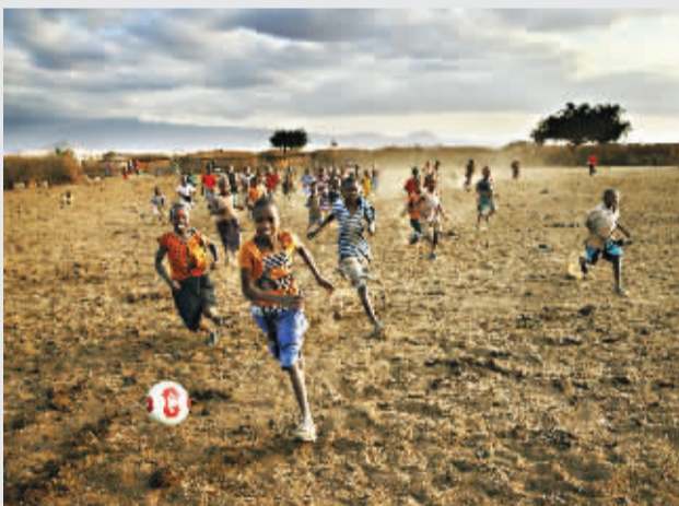
牛粪广场上的新生代