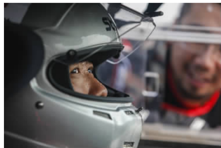
厚重的赛车服都采用防火材料,不论春夏秋冬,穿上之后就是一身汗水

今年9月28日,在东风公司第二届科技创新周上,东风AEOLUS车队被授予东风公司“创客空间”创新工作室,这是东风公司目前成立的三个创新工作室之一。