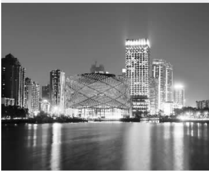
汉秀剧场“红灯笼”造型融入中国元素,武汉“设计之都”称号实至名归

11 月 1 日,武汉成功入选联合国教科文组织创意城市网络“设计之都”。此前,柏林、蒙特利尔、首尔、神户、上海、北京等世界知名城市曾入选。武汉以“老城新生”为申报主题,将创意设计作为城市发展驱动力,让老城不断焕发新活力。目前,武汉在桥梁工程、高速铁路等领域的创新设计能力处于世界领先水平。