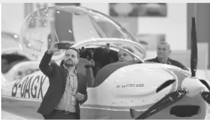
首架“武汉造”飞机卓尔“领航者 SL600”下线,工程师们忙自拍

11 月 2 日,首架武汉造通用航空飞机卓尔领航者 SL600 正式下线,标志着我市在飞机整机制造领域实现零的突破,并拉开武汉航空制造这一新兴产业的发展序幕。该机型最高航速每小时 265km,航程可达 1600km,最高飞行高度为 4000 米,起降距离为 100 米至 200 米,主要用于飞行培训、休闲娱乐飞行、短途旅行、观光旅游等。