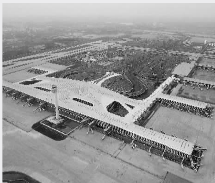
武汉天河机场 T3 航站楼,设计吞吐能力全年 3500 万人次

8 月 31 日,华中地区最大航站楼——武汉天河机场 T3 航站楼综合体正式投入使用。T3 航站楼综合体面积 49.5 万平方米,是 T1、T2 航站楼总面积的 3 倍,设计吞吐能力全年 3500 万人次,也是全国交通换乘一体化程度最高的枢纽之一。