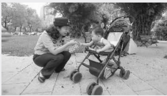
武汉不断创新社会治理,人民群众安全感稳步提升,今年再夺全国综治最高奖“长安杯”

10 月 11 日,我市正式发布留汉大学生毕业落户、住房、收入三大新政策,在全国率先实行大学生落户“零门槛”,率先让大学生能以低于市场价 20% 买到安居房、以低于市场价 20% 租到房,率先出台大学毕业生指导性最低年薪标准,让留汉大学毕业生能就业、易创业、快落户、好安居,打造“大学生最友好城市”,确保 5 年留下 100 万大学生。今年以来,我市先后推出两批共 6816 套大学毕业生租房;同时,年内将规划建设面积超过 1000 亩的长江青年城,为大学生留汉提供更多居住保障。截至 10 月底,在汉落户的大学毕业生达 78761 人,是去年同期 5.4 倍,是去年全年 4.4 倍。