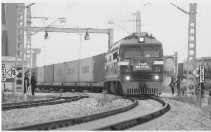
武汉已开通至德国、法国、俄罗斯等 16 条中欧班列线路

10 月 28 日,中欧班列开通武汉至法国杜尔日直达专列,这是国内中欧班列首趟由零售企业定制的专列。至此,武汉已开通至德国、法国、俄罗斯及中亚五国等 16 条中欧班列线路,辐射欧洲、中亚、西亚等 28 个国家,在全国开行中欧班列的 33 个城市中位居前列。截至 11 月 3 日,中欧武汉班列往返发运量达到 295 列,累计运载 2.7 万标箱,运输实载率达 98.77%,居全国第一。