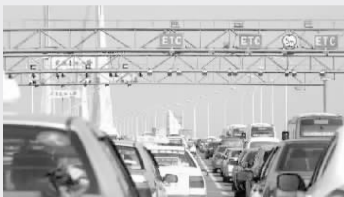
2018 年 1 月 1 日零时起,我市“九桥一隧一路”ETC 车辆通行费将停止征收

9 月 12 日,市委市政府决定,自 2018 年 1 月 1 日零时起停止征收我市“九桥一隧一路”ETC 车辆通行费。这一利国、利民、利城之事,是对“以人民为中心”发展思想的落实,将减轻武汉市民和企业负担,有利于促进三镇深度融合、一体发展。