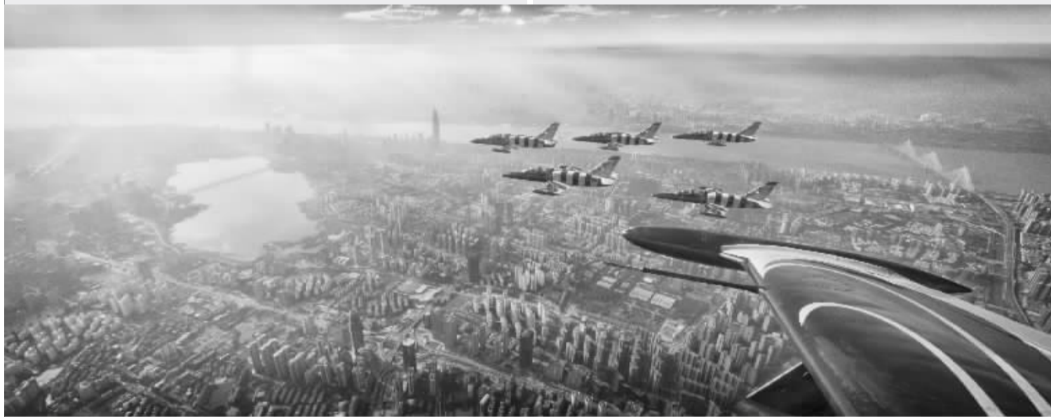
11 月 4 日至 7 日,首届国际航联世界飞行者大会在武汉举行,图为波罗的海蜜蜂队摄影师拍摄的飞越大武汉

9 月 19 日,武汉继 2013 年后再度被授予全国综治最高奖“长安杯”,同时荣获 2013—2016 年度全国社会治安综合治理优秀城市称号,武汉“红色引擎工程”“支部建在网络上”“万名警察进社区”等经验做法被推介。“长安杯”4 年评比一次,4 年来,武汉不断创新社会治理机制,确保了社会大局持续稳定、人民群众安全感稳步提升。