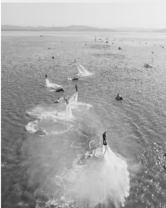
11 月 5 日,武汉市首届水上马拉松在东湖举行

11 月 4 日至 7 日,首届国际航联世界飞行者大会在武汉举行,吸引来自全球 40 多个国家和地区的千余名运动员参加,各类航空器和飞行器共计 1000 多架,赛期观众累计近 50 万人。世界飞行者大会是集体育竞赛、飞行表演、高峰论坛、国际会议、经贸活动等内容于一体的综合性国际航空运动盛会,会址将永久落户武汉,成为武汉又一城市节日和名片。