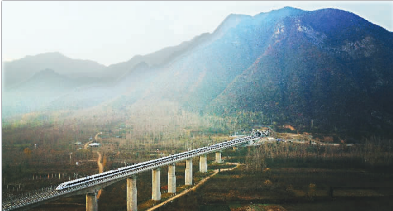
12月6日,西成高铁西安首发列车进入该条线路入秦岭第一个隧道。西成高铁陕西段桥隧比高达94,在秦岭山脉中超过10公里的特长隧道有7座