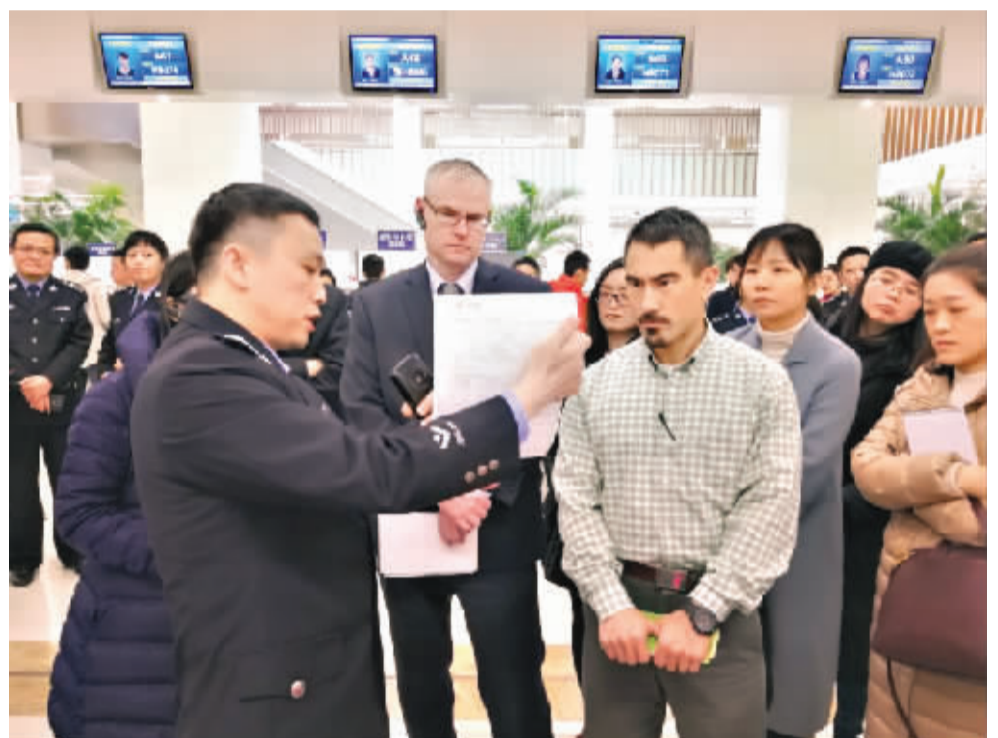
民警向外国驻汉领事官员介绍我市涉外警务

16时许,领事官员前往洪山区武珞社区警务室参观。洪山区武珞社区警务室是武汉市首个标准化涉外警务室,设有警务服务区、文化交流区和人才服务区,装配境外人员服务平台和中英文双语标识,并组织了20名外籍志愿者,能将外国人住宿登记、报警求助、法律咨询和纠纷调解业务进一步向外国人聚集的社区延伸。该警务室已举办社区中外交流活动12场,调解案件7起,接受咨询398人次。据了解,3年内武汉还将设立20个涉外警务室。 活动中,外国领事官员们纷纷为武汉国际化水平点赞。美国驻汉总领事馆领事陈路家(TERRY DON MOBLEY)表示,武汉的涉外警务科技含量十足,而且十分人性化,民警亲切的服务让前来办理业务的外国人不会感到紧张。凭借这份诚意,以后一定会有更多外国人愿意留在武汉工作与生活,为城市的发展注入新的活力。