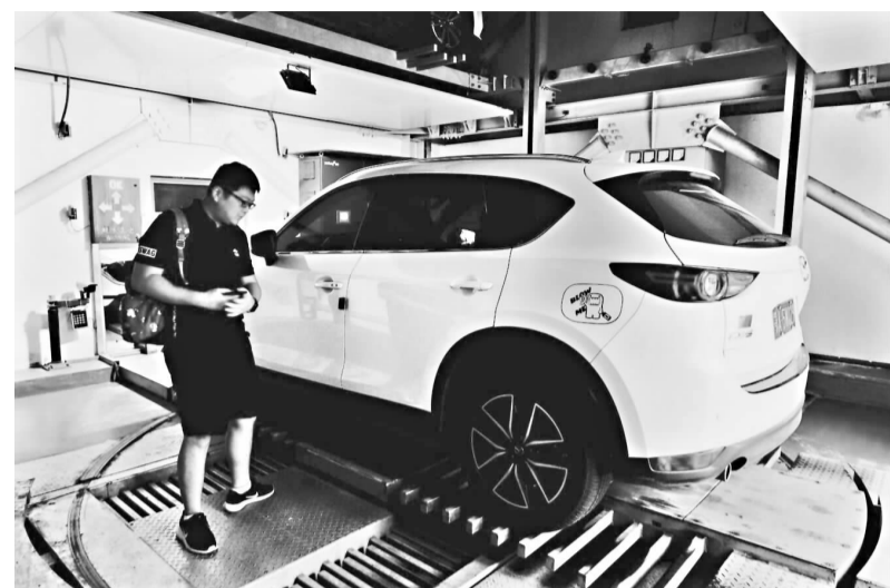
在智能车库,小车就像坐电梯一样被送至空车位

长江日报讯(记者黄征 通讯员陈张京 汪照琪 郑浩南)建设公共停车位,缓解市民停车难,从2015年到2018年,我市连续4年将其纳入政府“十件实事”。12日,市委市直机关工委举办“我是武汉好声音”第十一期“聚焦新增停车位建设”活动,规划部门呼吁,为进一步缓解市民停车难,学校、机关等充分利用自有用地,建设停车位尤其是节地、高效、绿色的智能机械车库,并对外开放。