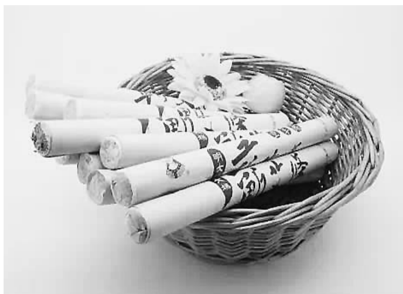
由艾绒卷制而成的灸用制品艾条

中草药艾叶终于有了国际标准!6月4日,在中国上海召开的国际标准化组织中医药技术委员会第9次全体会议上,发布了由中南民族大学主导制定的中药材艾叶国际标准。这意味着我国主产的中药材“艾叶”将按国际标准规范步入国际化,也将越来越被世界各国所喜爱。