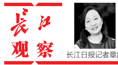
长江日报记者章鹤