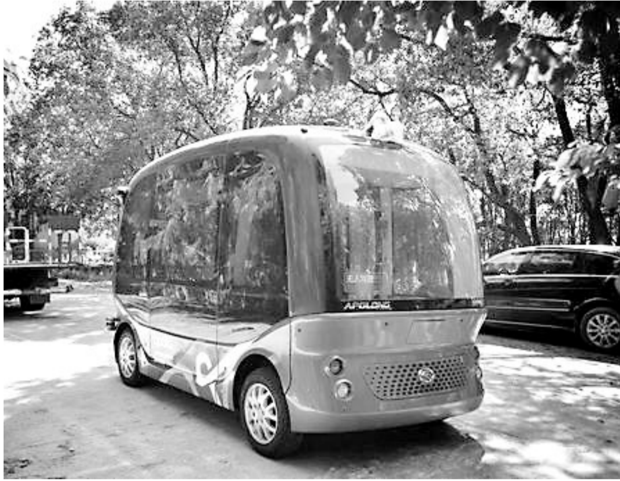
百度无人驾驶巴士“阿波龙”运抵武汉开发区。该车为小型巴士,外观圆润