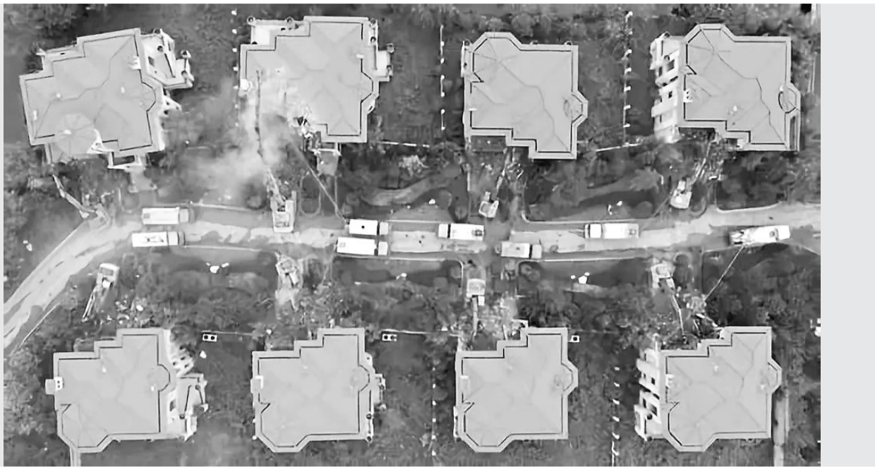
“秦岭别墅”正在拆除

光口头上讲政治,本质只有一种“口头政治”,其结果是架空讲政治,最终就变成不讲政治的一块遮羞布。表态的时候语气高昂、口若悬河、天花乱坠,但实际工作中将政治忘到九霄云外,搞我行我素、各行其是,大搞形式主义、官僚主义,一些领导干部甚至走向腐化变质。