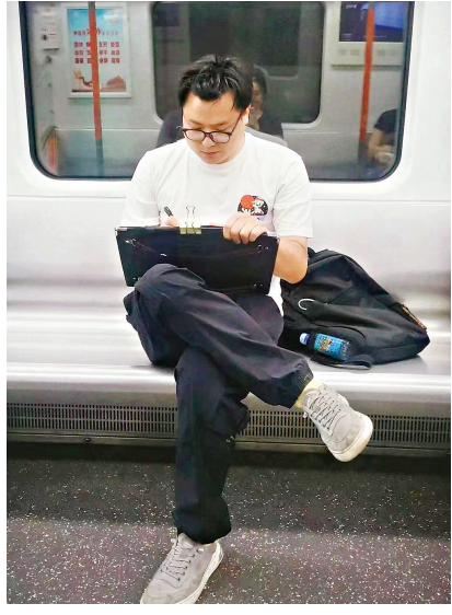
网友@桃酱正在地铁车厢里免费给陌生人画卡通速写。

如果在两分钟里让你认识一个人,你会感兴趣吗? 6月17日,我乘坐武汉地铁7号线从湖北大学站前往香港路站。在短短十几分钟内,我拿出白纸、画笔和画板,实施我的“两分钟认识计划”。 “两分钟认识计划”是指用两分钟给陌生人画一幅卡通速写。在这两分钟里,我会迅速观察想绘画的对象,并和对方进行眼神交流。当对方接收到我的“眼神讯息”后,我就知道:对上了,开画!迅速画完后,我会将作品免费送给对方,然后与其进行简单交流。有时候,我会将一个人画两遍,把满意的那幅画送出。他们收到我的作品时往往都很惊喜:“有意思,很像我!”“谢谢你,很喜欢!” 6月17日,在十几分钟内,我先后