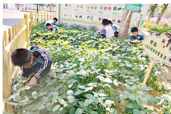
新洲区第一初级中学学生在校园里的蔬菜基地劳动。 通讯员徐怀武 摄

市场监管部门提醒市民,如发现有私屠滥宰、经营病死畜禽、掺杂掺假、以假充真、以次充好等违法行为,可以通过拨打电话12315或12345进行投诉举报,执法部门将及时受理、依法处置。 (文:许霄 余斌斌)