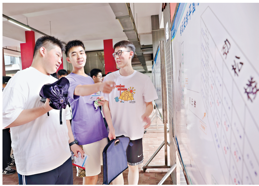
6月19日下午,七一中学考点内,中考考生们看考场。

你家附近有托育机构吗 @姜亮:我们当父母的希望相关部门能够多提供一些公办托育服务,价格更加实惠一点。 @大武汉用户-3617:武汉经开区的托育机构太少了。希望增设机构,在寒暑假和周末托管孩子。这是双职工家庭非常需要的。 @大武汉用户-7432:位于汉阳四新片区的武汉国博新城小区是新建小区,很多居民都是双职工,特别需要托育机构。 (整理:沈欣)