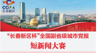
“长春新区杯”全国副省级城市党报短新闻大赛

长江日报记者，2018年，这款农机在他的果园落地，彻底解决了“物资上山、果实下山”的大难题。