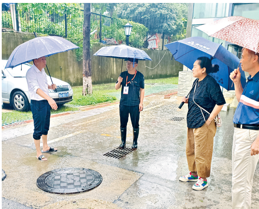
防汛应急专家正在小区里向居民了解排水情况。

根据不同小区存在的不同问题,专家指导各小区制定了详细的防汛排渍应急预案,并严格落实24小时值班值守,确保在紧急情况下能够迅速响应、有效处置,及时报送相关信息。