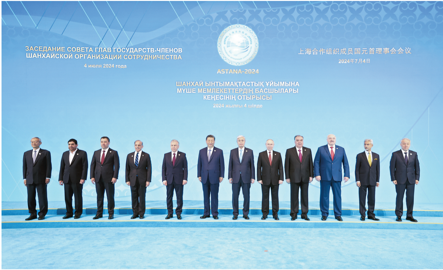
当地时间7月4日上午,国家主席习近平在阿斯塔纳独立宫出席上海合作组织成员国元首理事会第二十四次会议。