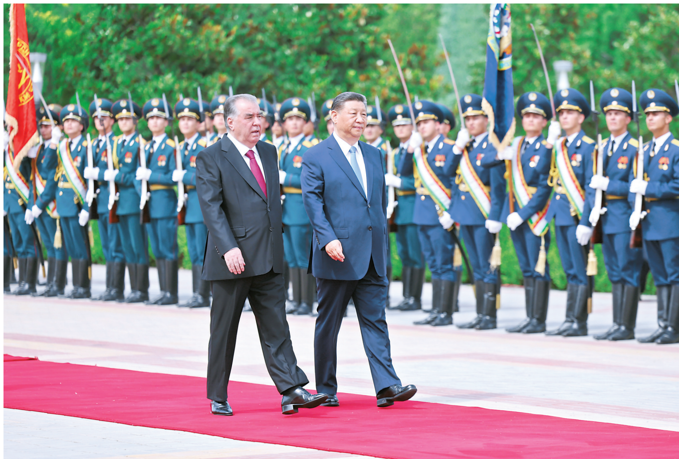
当地时间7月5日下午，国家主席习近平同塔吉克斯坦总统拉赫蒙在杜尚别总统府举行会谈。拉赫蒙为习近平举行盛大隆重的欢迎仪式。这是习近平在拉赫蒙陪同下检阅仪仗队。