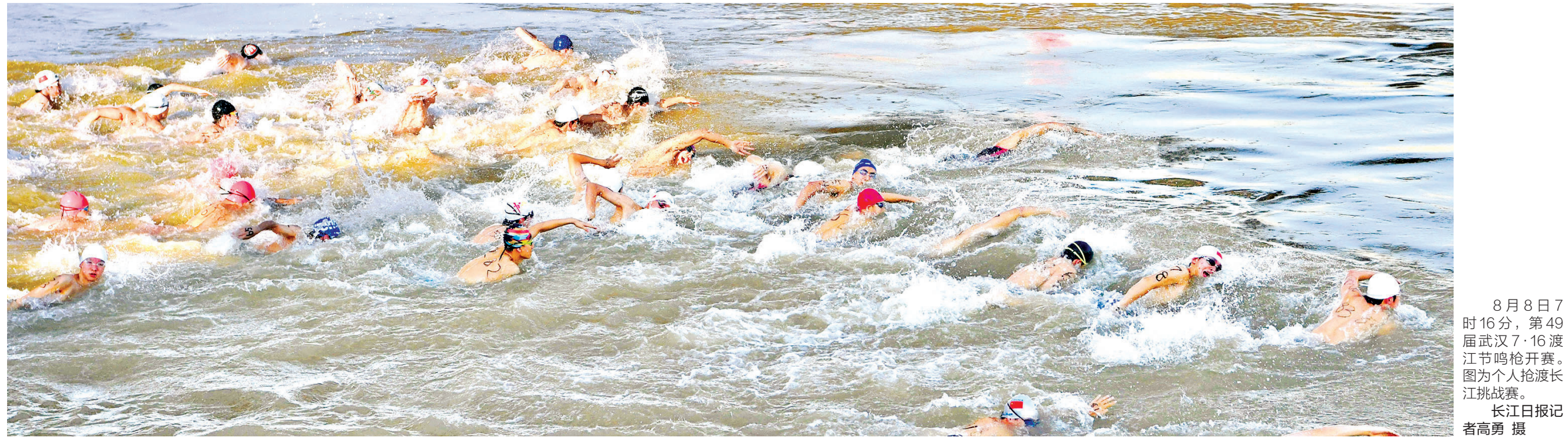
8月8日7时16分，第49届武汉7·16渡江节鸣枪开赛。图为个人抢渡长江挑战赛。