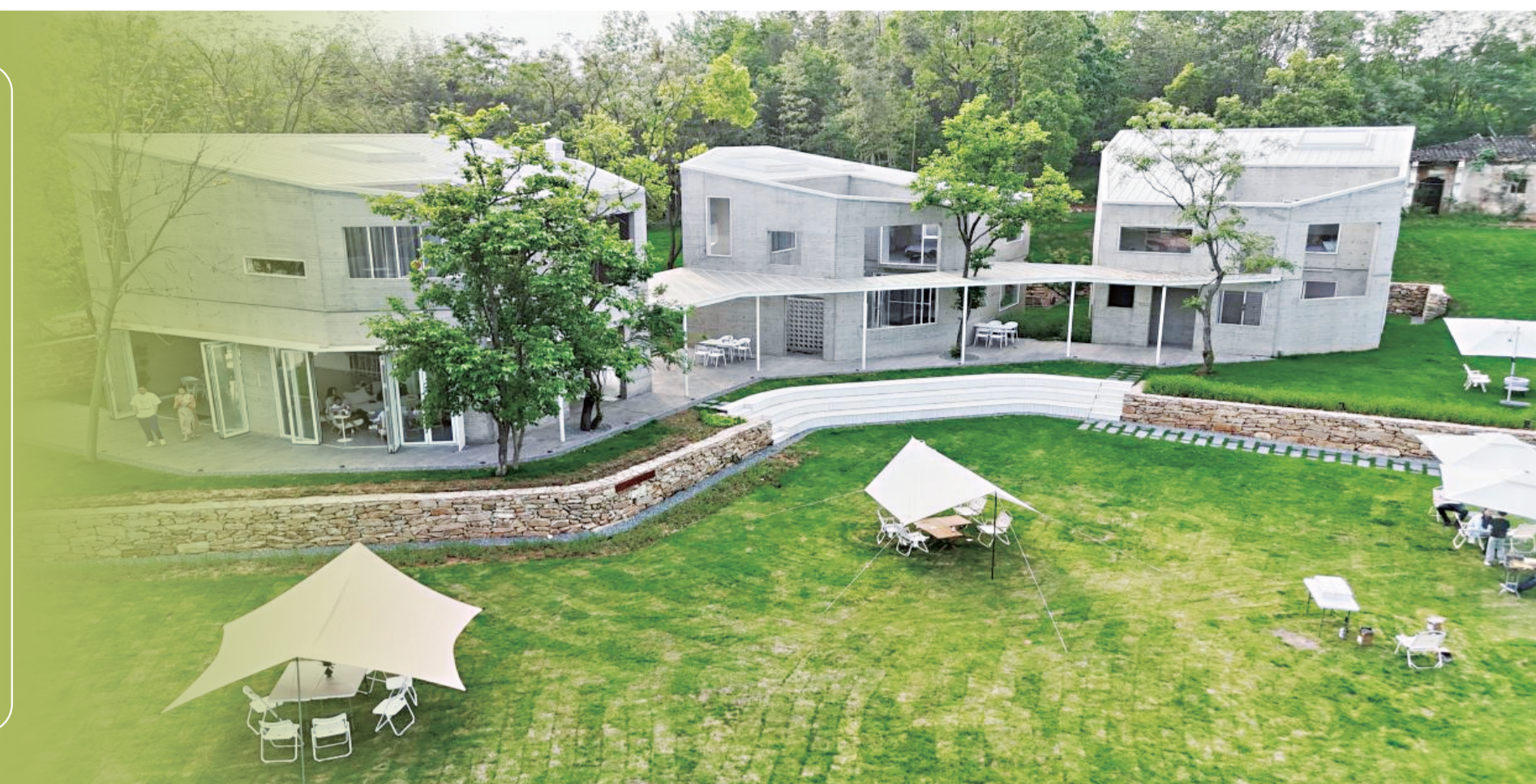
极富艺术设计感的木兰暖村创新力十足。

300年后的今天，木兰暖村的一砖一瓦都承载着古老的传说和故事，也融入了极富艺术设计感的现代元素。郁郁葱葱的百年古树与古拙而时尚的现代民宿交相辉映，既保留了自然生态的原始美，又展现了现代设计的创新力，完美呈现了人与自然的和谐共存。