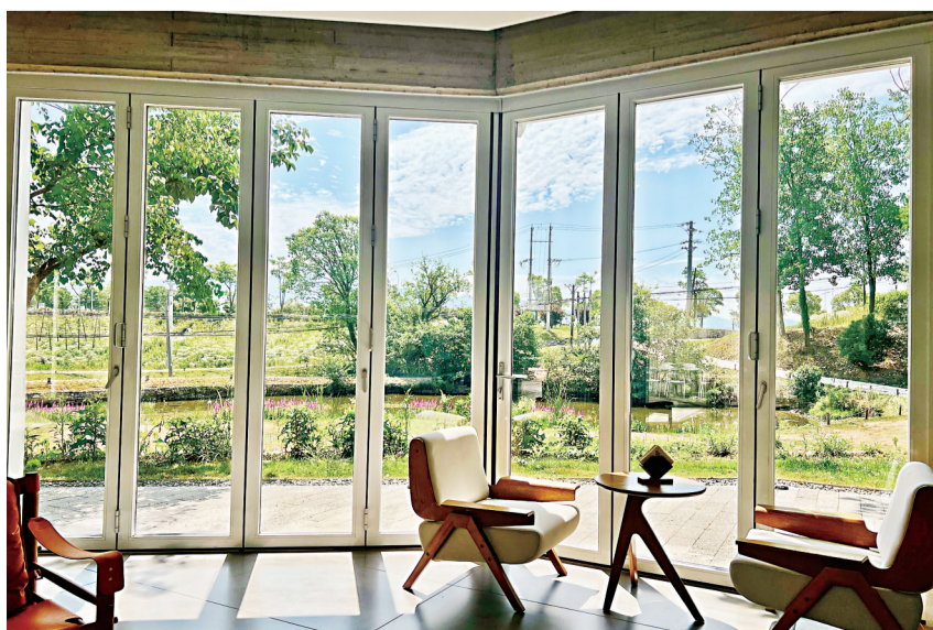
住进木兰暖村民宿，推窗即景。