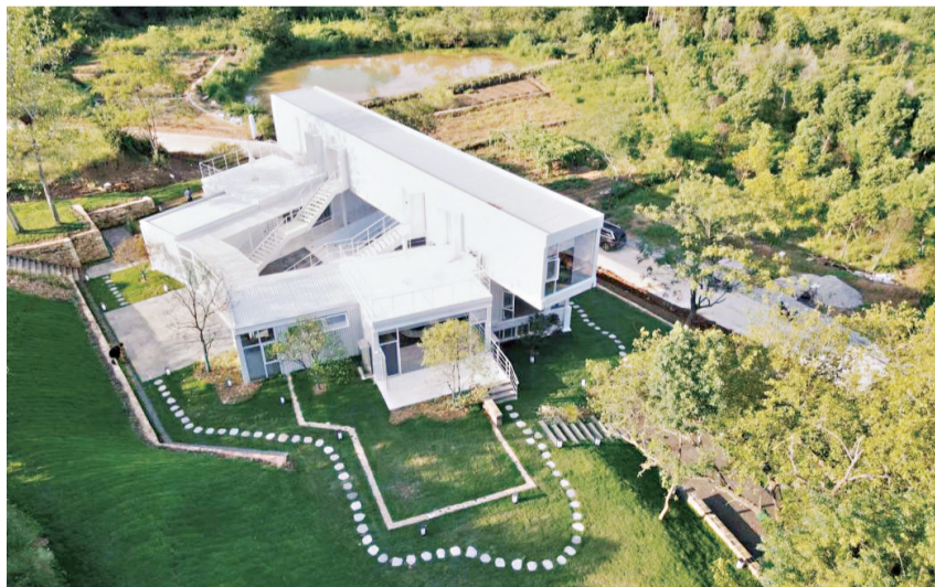
鸟瞰木兰暖村，风格各异的民宿被青山绿水环抱。