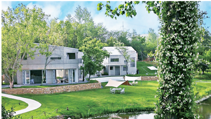
山水交织的木兰暖村郁郁葱葱。