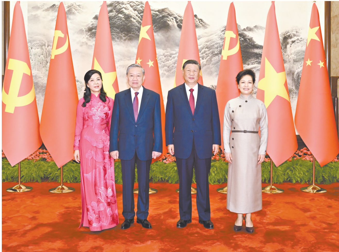
8月19日,中共中央总书记、国家主席习近平在北京人民大会堂同来华进行国事访问的越共中央总书记、国家主席苏林举行会谈。这是会谈前,习近平和夫人彭丽媛同苏林和夫人吴芳璃合影。