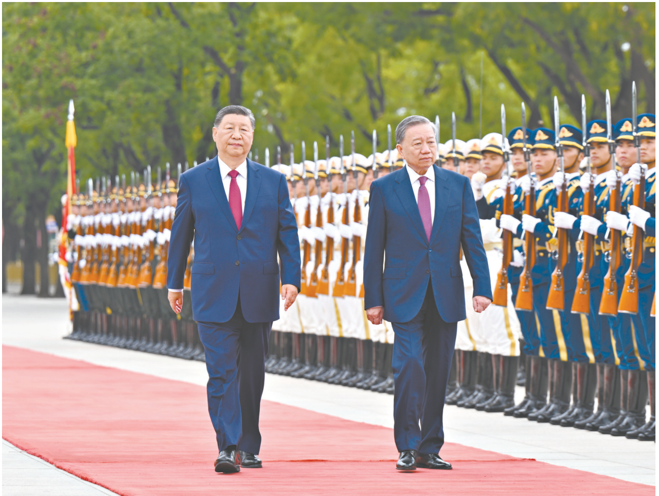
8月19日,中共中央总书记、国家主席习近平在北京人民大会堂同来华进行国事访问的越共中央总书记、国家主席苏林举行会谈。这是会谈前,习近平在人民大会堂东门外广场为苏林举行欢迎仪式。

习近平指出,面对世界之变、时代之变、历史之变,中越两国保持经济快速发展和社会长期稳定,彰显了社会主义制度的优越性和社会主义事业的生命力。中方将越南作为周边外交优先方向,支持越南坚持党的领导,走符合本国国情的社会主义道路,深入推进革新开放和社会主义现代化事业。在各