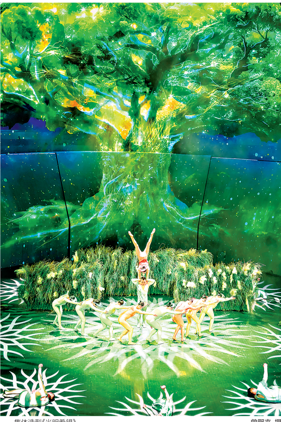
集体造型《光明希望》。