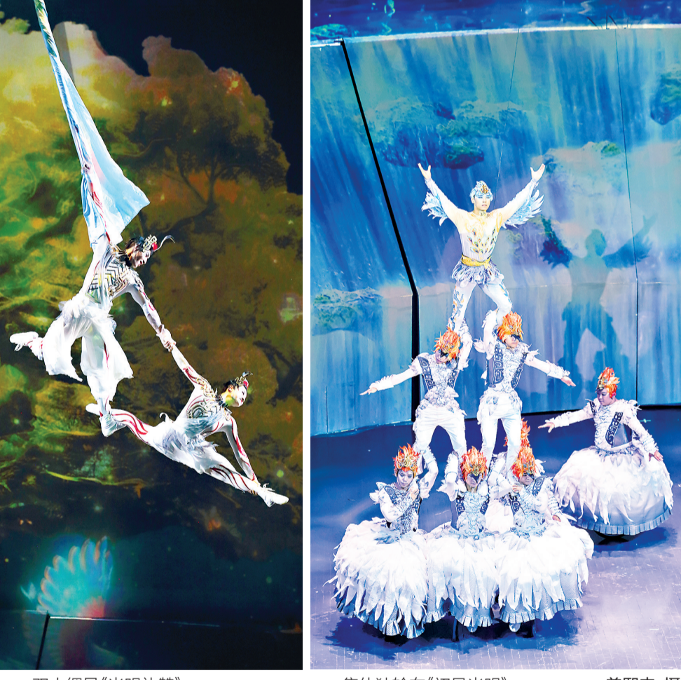
双人编吊《光明礼赞》。