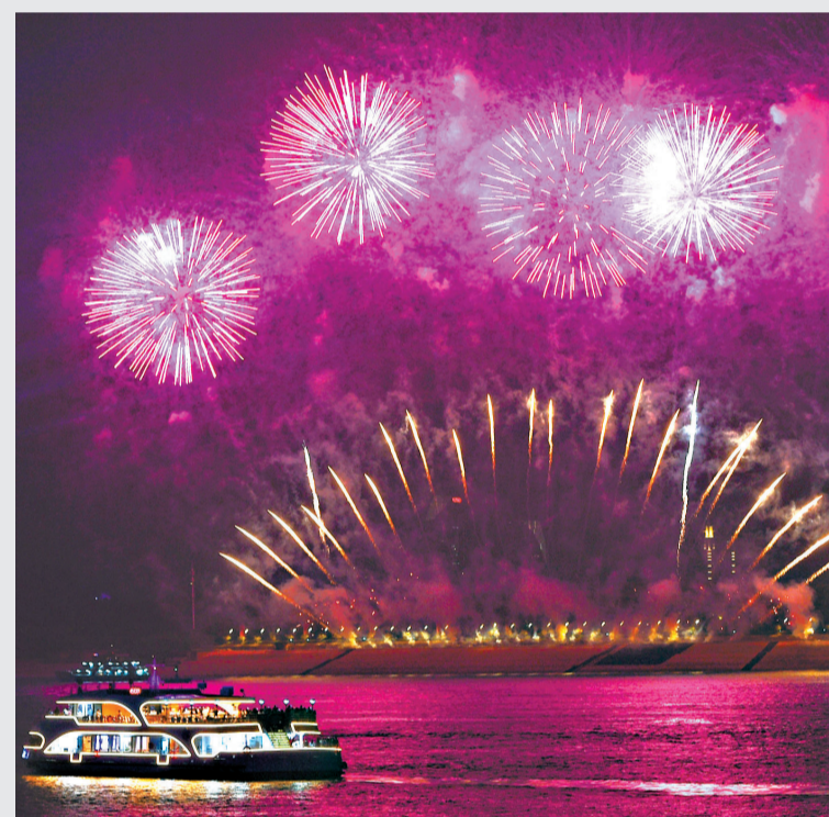
上图：大型烟火秀从江上喷薄而出。