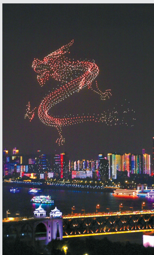
右图：千架无人机腾空而起，瞬间点亮天幕。