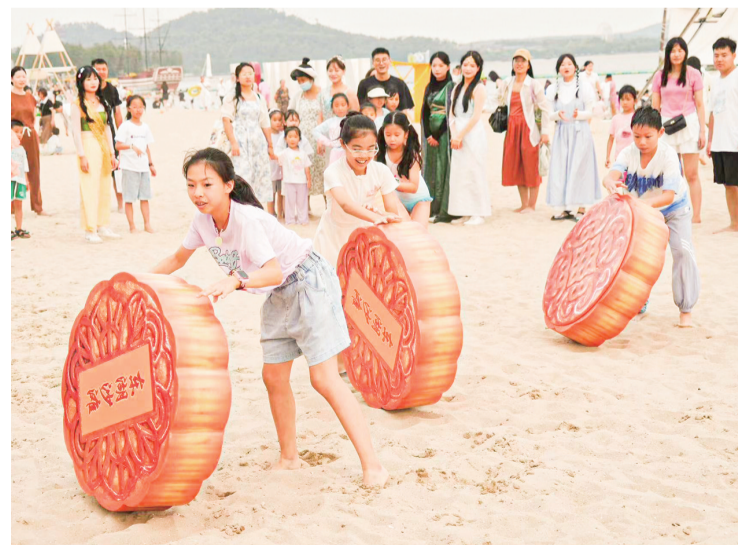
9月15日，不少游客携亲带友共游东湖，孩子们在东湖沙滩景区开心地玩游戏。

以赏月文化为核心的“中式夜游”成为今年中秋假期的文旅消费热点，“赏月航班”、集市灯会等玩法受到游客欢迎。（下转第三版）