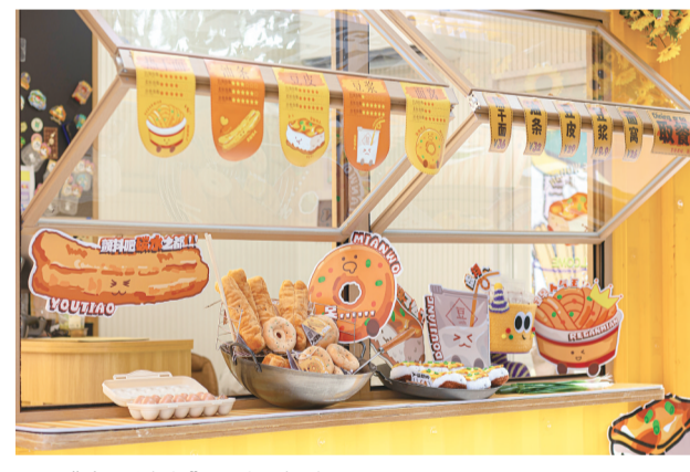
“全员饿人”系列早餐产品。

长江日报 “老板,我要一份豆皮,摊脆一点。”10月5日上午,位于汉口咸安坊的早餐店“全员饿人”一开业,已排队等待一个小时的顾客便迫不及待地开始“点餐”。