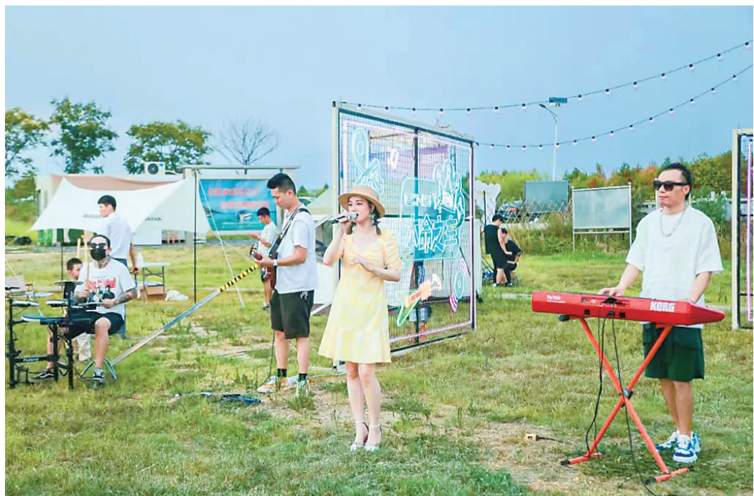
右图:游客在江夏区群益村云稼慢乡景区感受慢生活。