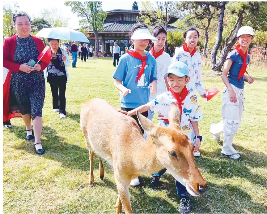
左图:小朋友们在东西湖区乡伴慈惠景区与小鹿为伴。