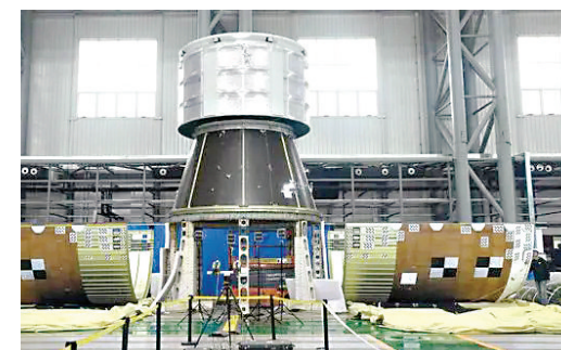
长征十号系列运载火箭近日成功完成整流罩分离试验。

当前,长征十号系列运载火箭已完成一子级动力系统试车等大型试验,按照研制计划后续还将持续开展一系列试验项目,对各系统设计进行全面验证。