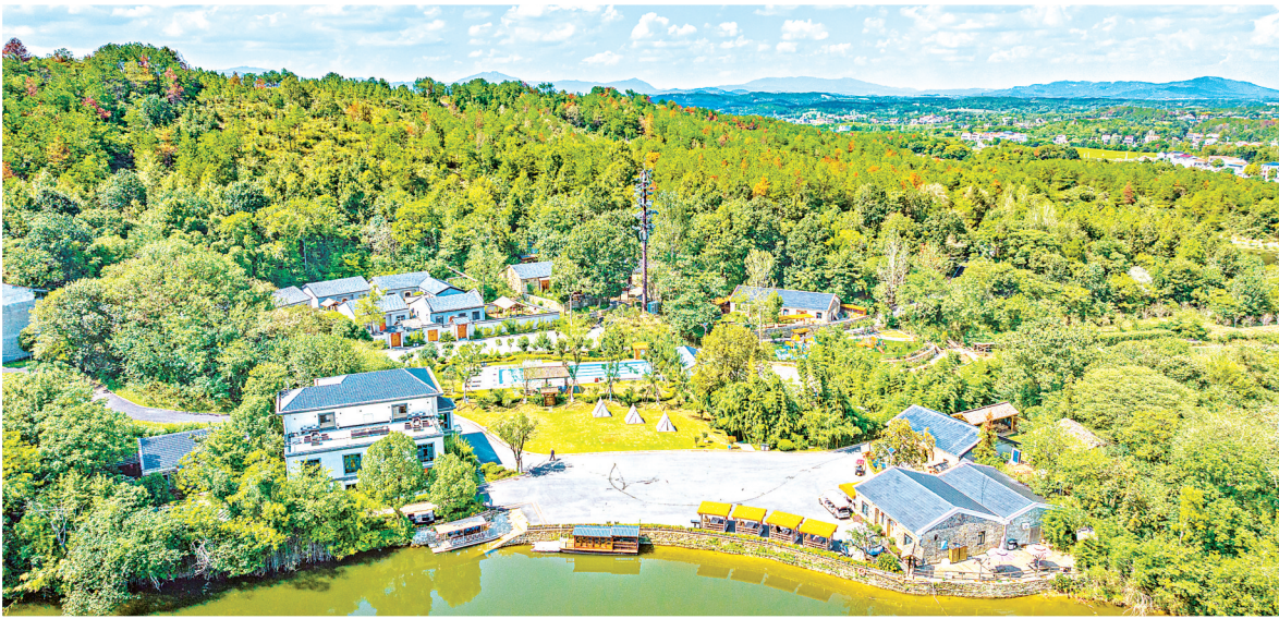
裕和夫子山民宿群依山而建，傍水而居。