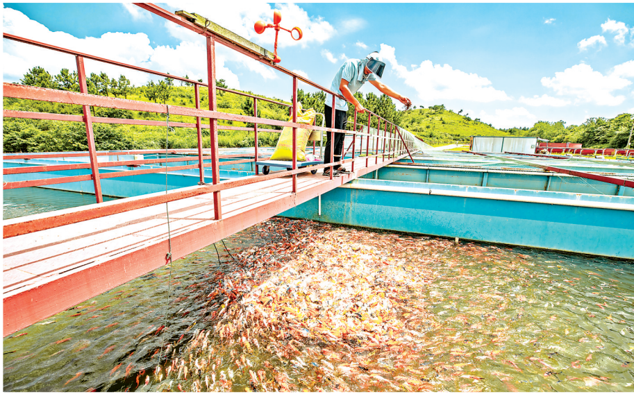
全省最大鳊鱼苗繁育基地“鑫鳊源”养殖基地。

周末的午后，走进长轩岭创造村“蘑菇部落”，三五成群的游客或聚在草地上唱歌，或在帐篷下烧烤，或在草坪上围炉煮茶，孩童满地奔跑，很是惬意，很让人放松心情、享受生活。到了夜晚，这里更是灯光璀璨、流光溢彩，将乡村的轮廓勾勒得更加清晰、宁静。