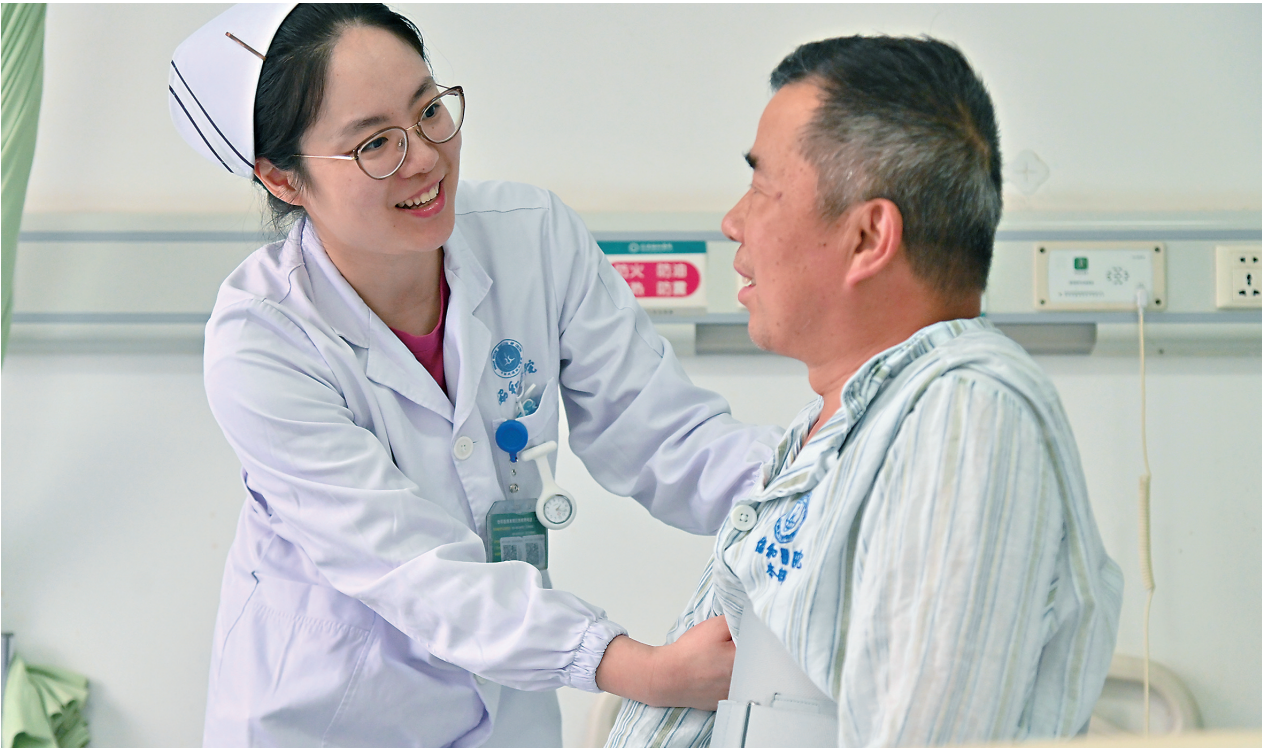
责任护士履行关怀职责关心鼓励患者。

一年多来,协和医院4300名护士写下了10万个“关怀的故事”,上面自动生成患者信息,这些真实案例将成为有价值的病案资料。