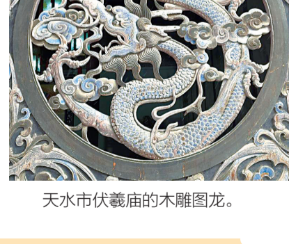
天水市伏羲庙的木雕图龙。