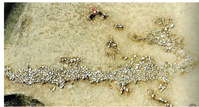
焦墩卵石摆塑龙(新石器时代)。该文物被誉为“长江流域第一龙”,现藏于湖北省博物馆。