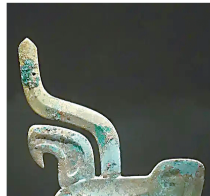
铜龙形饰(商代晚期)。