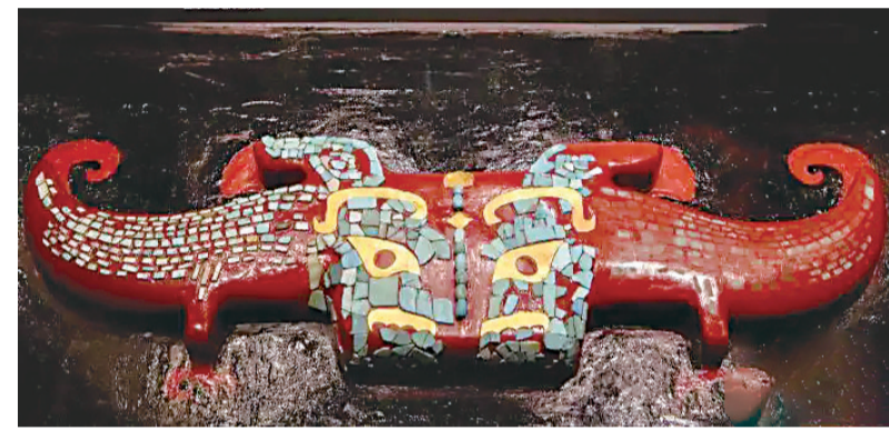
专家团队复原的盘龙城绿松石镶嵌饰件。该饰件是目前中国发现的唯一一件商代早期最完整成型金玉器,也是年代最早的单体一首双身龙形器。