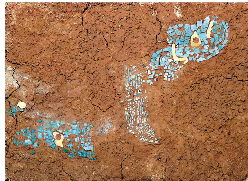
湖北武汉盘龙城遗址杨家湾M17出土的金片绿松石镶嵌饰件(资料照片)。新华社发