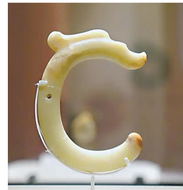
玉“C”形龙(新石器时代红山文化)。