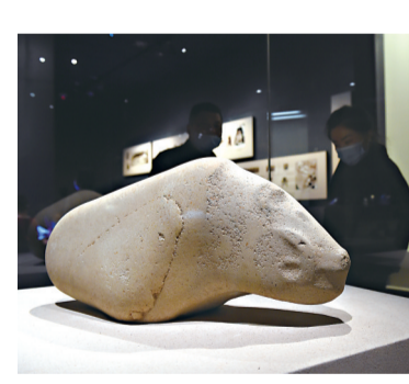
凌家滩遗址出土的玉(石)猪。新华社发