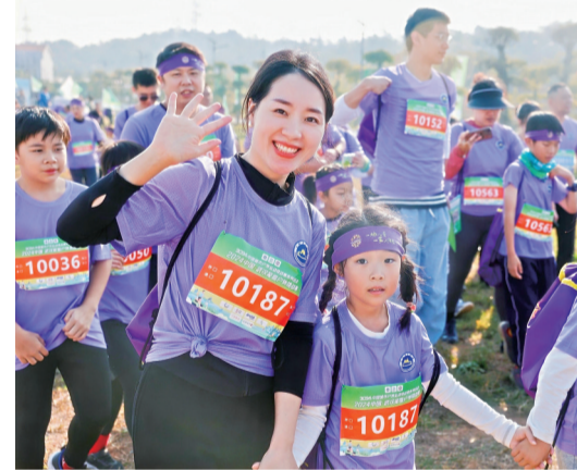
2024中国·武汉家庭户外挑战赛现场(资料图)。

武汉体育金秋消费季·2025中国城市户外运动挑战赛系列活动由国家体育总局登山运动管理中心、中国登山协会、武汉市体育局主办,武汉长江日报传媒集团、中国地质大学(武汉)、江夏区委宣传部承办,江夏区文化和旅游局、江夏区纸坊街道办事处、中国地质大学(武汉)体育学院暨中国登山户外运动学院、武汉大青八户外运动有限公司协办,武汉长江日报体育文化发展有限公司组织运营。