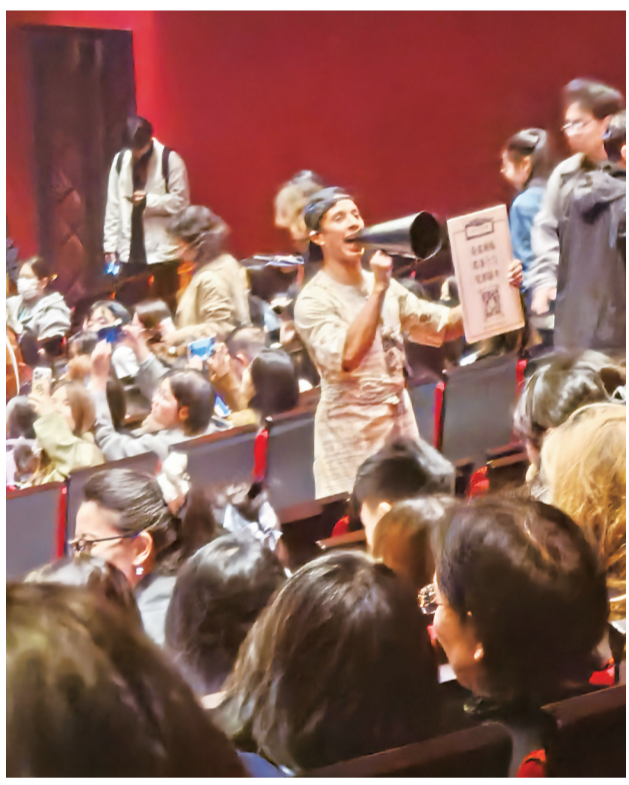
《莫里哀》演出现场,报童在观众席间叫卖“号外”。