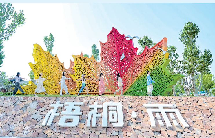
梧桐雨生态休闲中心。