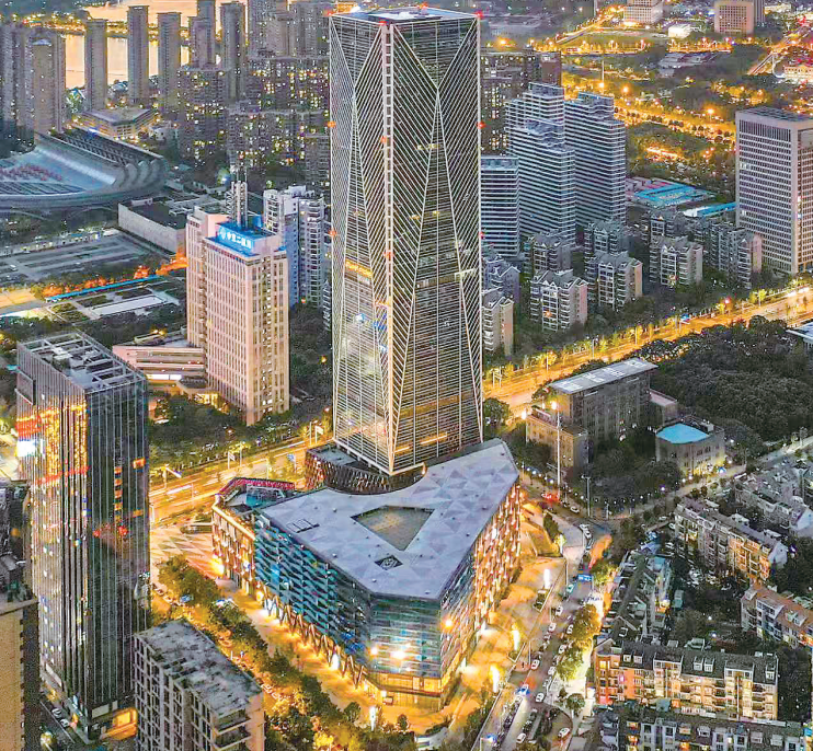
夜幕下的金银湖街。