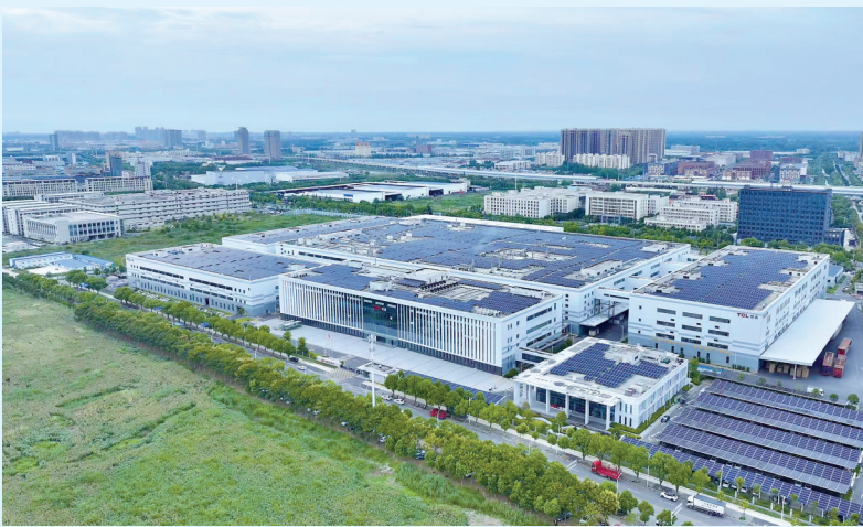
东西湖区智创小镇。