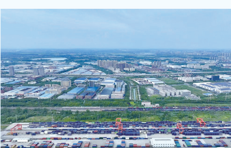
中欧班列吴家山起运站。