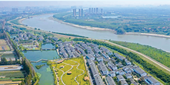
东西湖区乡伴慈惠景区。