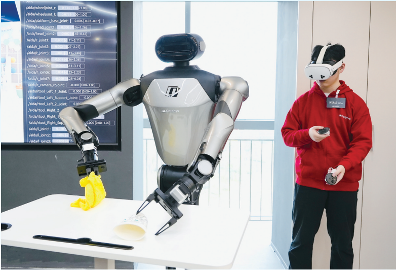
国家网安基地机器人仿真训练场。

“十四五”期间，东西湖区电子信息产业初步成链，创维满产增效，京东方扩产完工，江丰电子一期、志丰精密科技项目等建成投产，广钢气体武汉大宗气体站、武汉振兴半导体生产基地一期加快建设，“芯屏端”电子信息产业链条不断夯实。