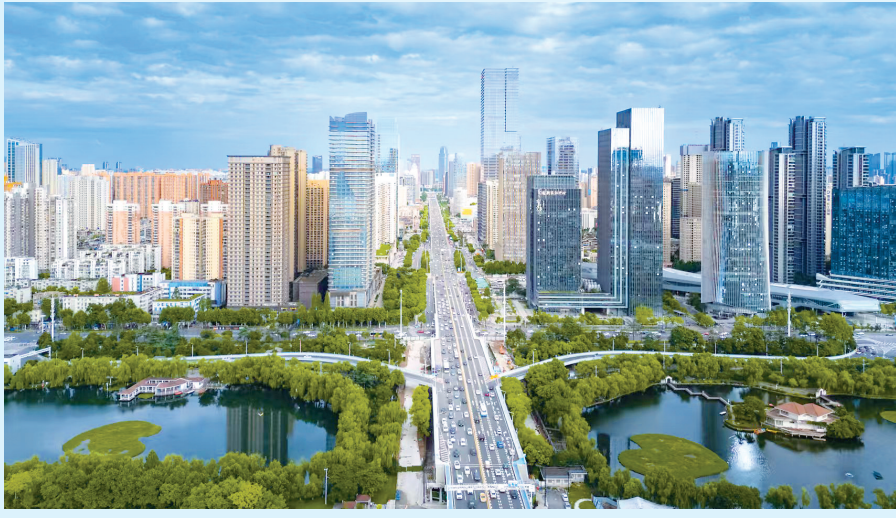
武汉滨江数创走廊。