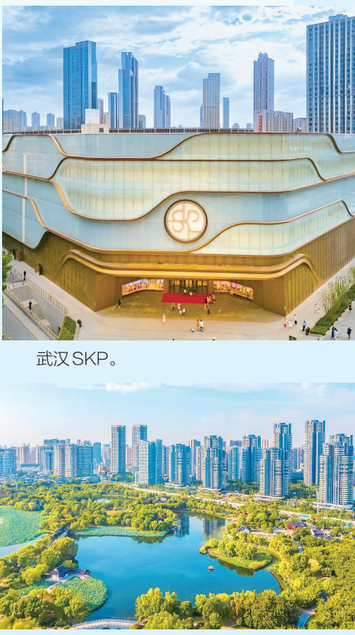
环沙湖双碳经济带。