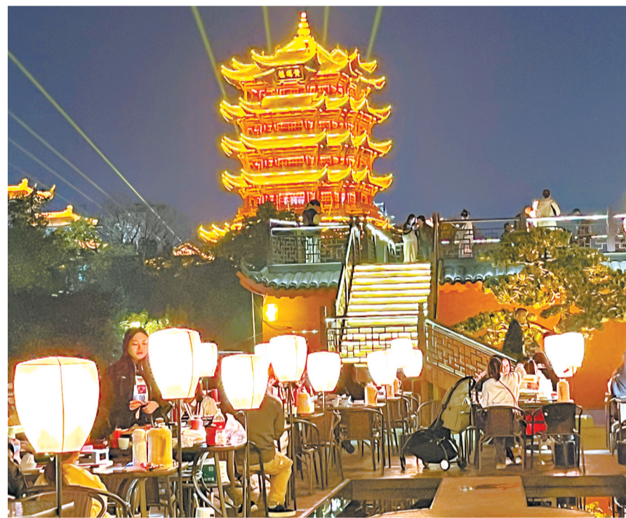
“山顶烧烤·又见黄鹤楼”店可无遮挡观赏黄鹤楼。