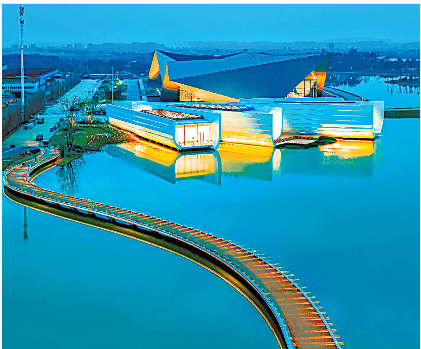
沉湖国际小镇分会场如“折纸飞鸟”，栖息于水天之间。