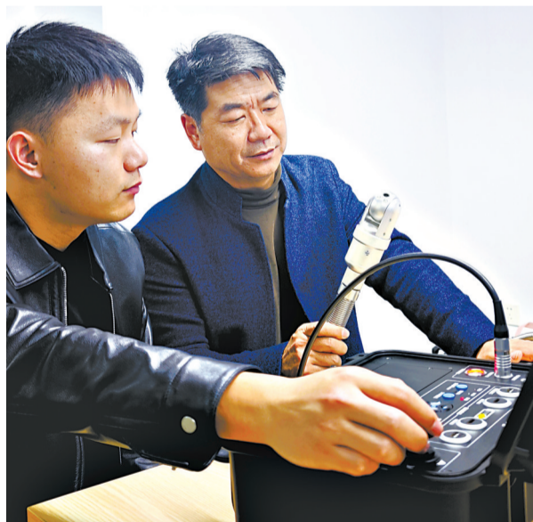
研发人员调试微型耐辐照水下高清摄像头。

水下微型高清摄像头能在核电厂的辐射环境里工作超过100个小时，而且能够传回清晰的画面