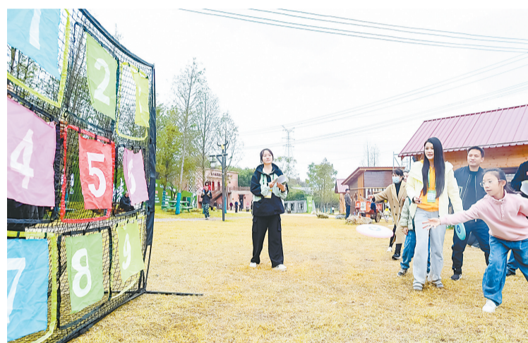
小朋友参加趣味挑战活动“趣味飞盘”。