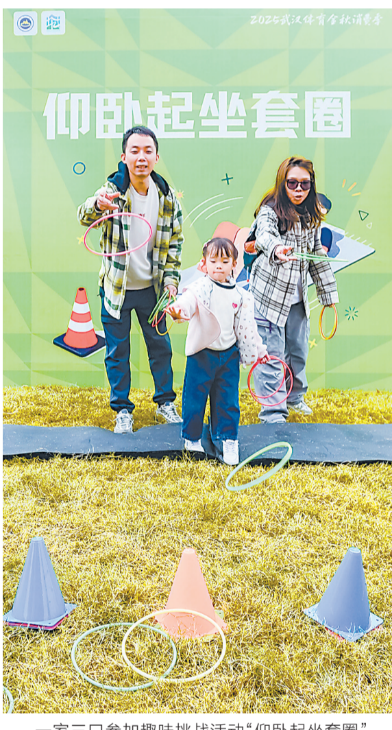
一家三口参加趣味挑战活动“仰卧起坐套圈”。