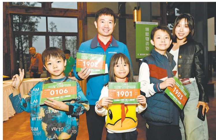
参赛家庭展示号码布。