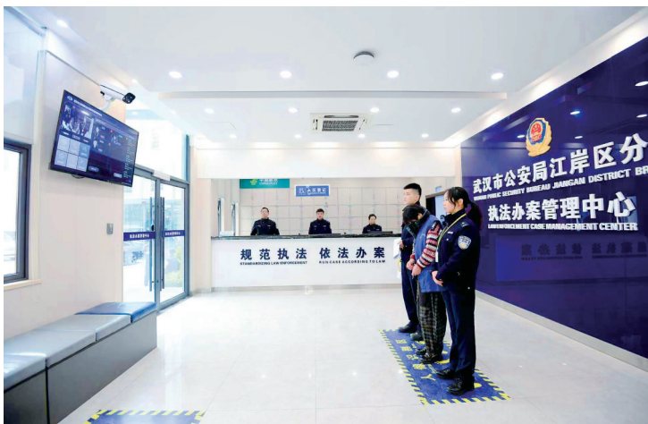
江岸区分局执法办案管理中心大厅，一名嫌疑人正通过智能管理系统办理入区登记。

在制度建设上，全市执法办案管理中心均由法制部门统一管理、统一监督、统一服务。同时，武汉公安制定《执法办案管理中心使用管理工作规定》《规范破案提升案件办理质效指导意见》等工作制度，明确民警岗位职责、办案流程标准；创新“线上+线下”监管模式，通过法制、监管、督审部门联动巡查、网上交叉巡查和实地检查，及时发现整改安全隐患，确保各项规定落地落实，让执法在“阳光下”运行。