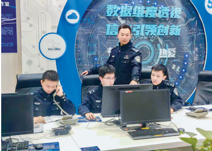
武汉公安智能化执法监管系统依托数据模型主动发现执法问题，预警风险。