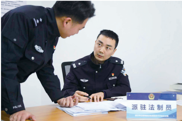
东新分局派驻法制民警同步上案、审核把关，提高办案质效，把好“出口关”。