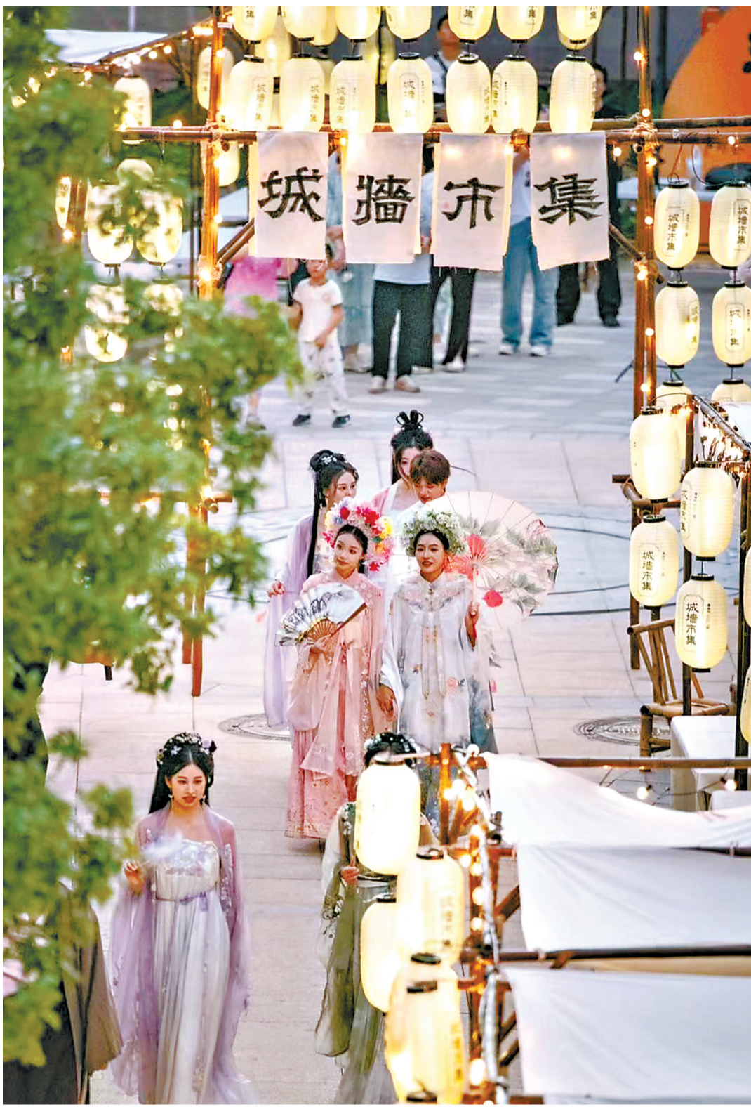
从昙华林主街到山顶的百米道路旁,聚集了10多家汉服馆、旅拍店、旗袍店。