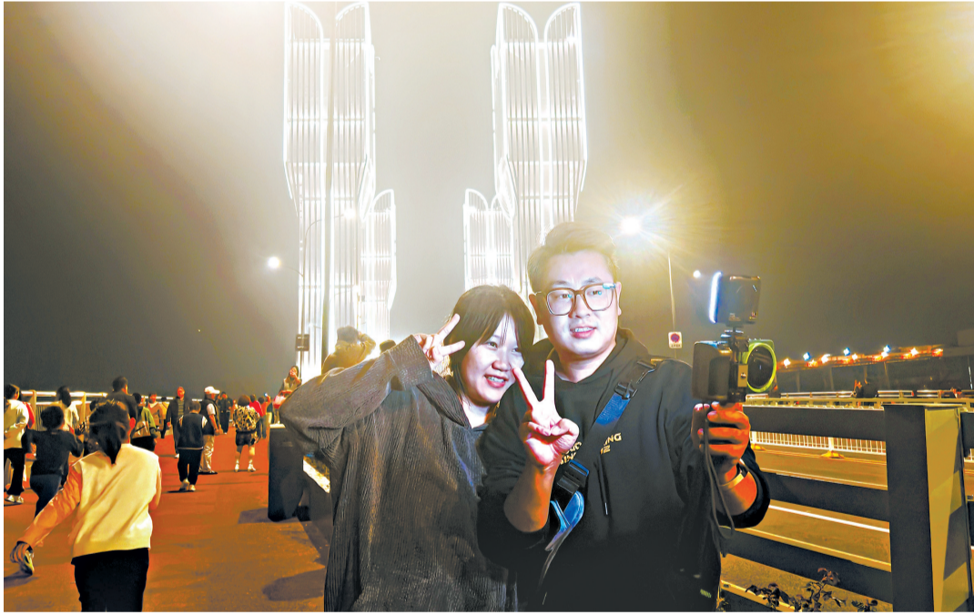
右岸大道开启桥行人如织,众多市民前来打卡这座新晋“网红桥”。