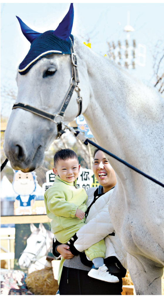
市民和白马欢乐合影。