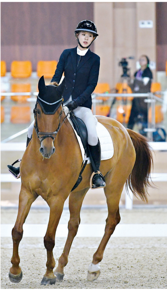
优雅的盛装舞步项目在舒缓的音乐中进行。

武汉商学院体育学院相关负责人表示，本届马运会暨赛马节是一场集专业竞技、教育赋能与全民共享于一体的马术盛会，未来将不断丰富赛事活动内容，力争将武汉马运会暨赛马节办成全国乃至全球知名的马术活动。