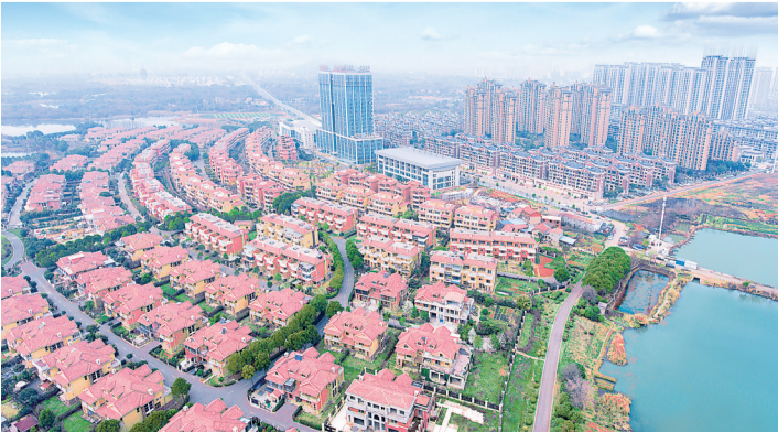
标杆社区：同济社区是全市首批国际化社区试点之一。