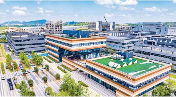
产业园区：中电光谷数字经济产业园。