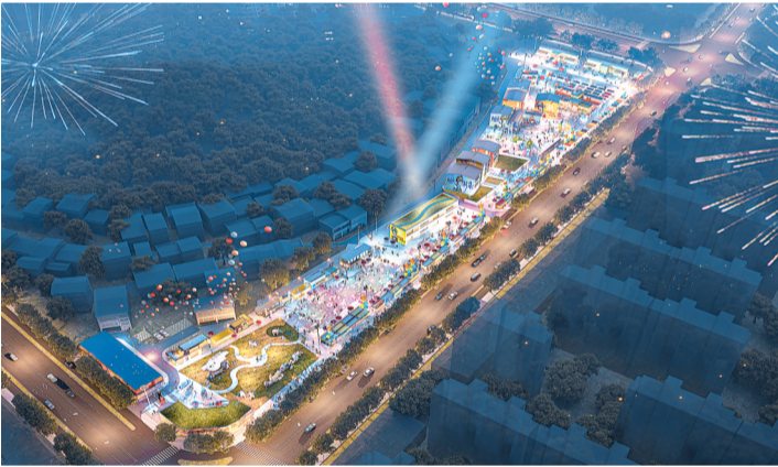
特色街区：九坤金街·烟火潮集。