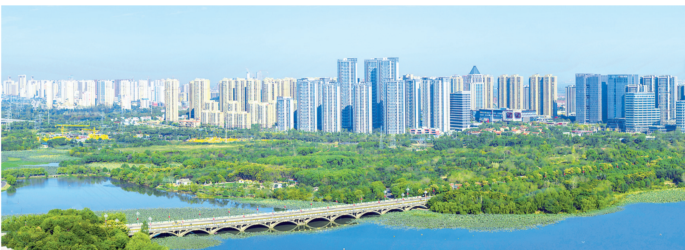
武汉西崛起一座宜居宜业的现代化新城。