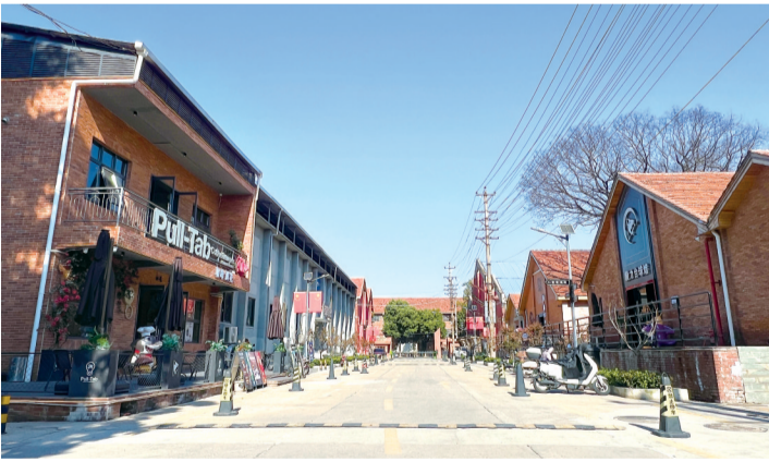
老旧厂区：“毅力梦工厂”，曾经的红砖厂房蝶变新业态孵化器。