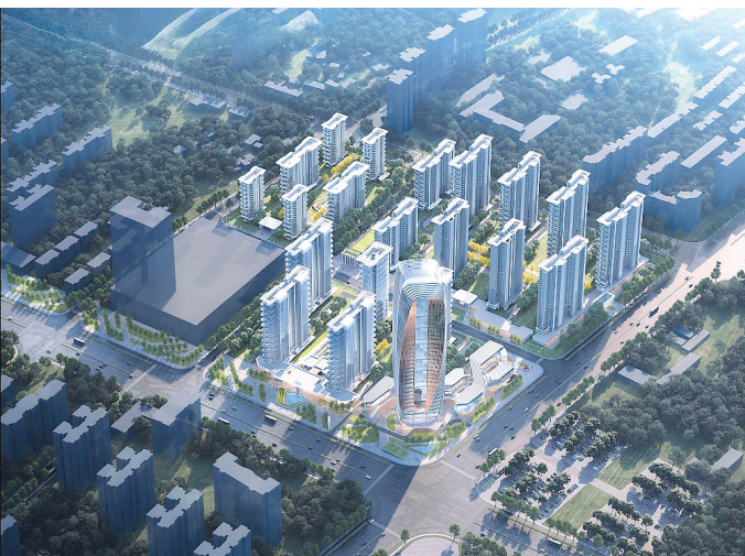
空中花园式“第四代住宅”效果图。

中粮ABC地块作为江夏区城市更新的缩影，从工业厂房到生态居所的华丽转型，折射出江夏从追求规模扩张到注重品质提升的城市升级之路。