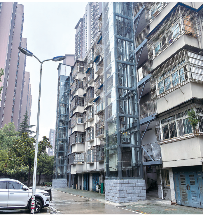
纸坊街道人大小区加装电梯后，方便了居民的出行。

既有住宅加装电梯，看似是“关键小事”，却是检验城市治理温度和精度的“民生大事”。