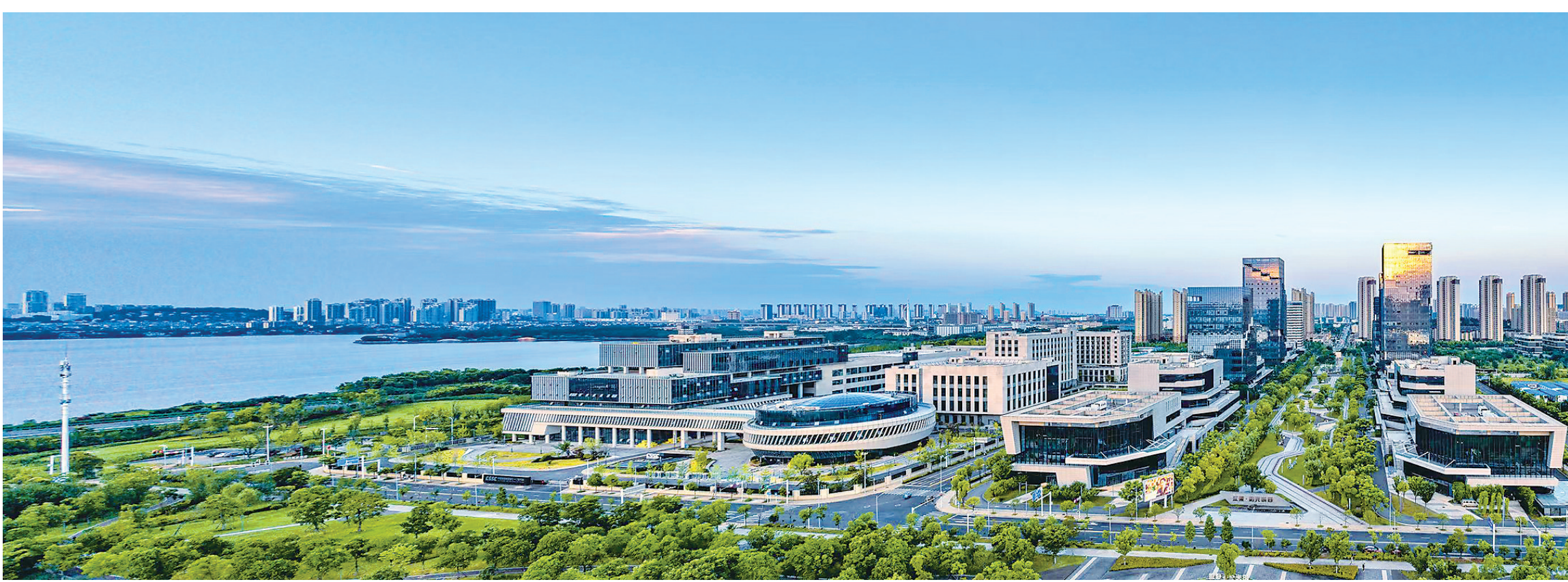
江夏将重点推进汤逊湖大湖区城市更新。