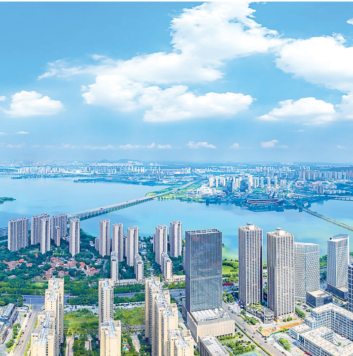
江夏区将科技工作者社区作为首批“小而美”更新片区。

城市竞争，归根结底是人才与产业的竞争。江夏区创新性将城市更新与产业升级、人才引进深度融合，满足高端人才需求，规划建设高标准、定制化、多元融合的科技工作者社区，旨在打造吸引、服务、留住高端科技人才 的“强磁场”和“梦想栖息地”。