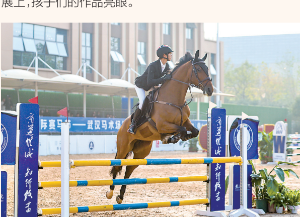
武汉商学院获批全国首个马术运动与管理本科专业。