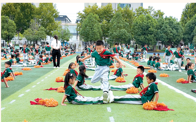
光谷十四小学生在大课间玩体能游戏。