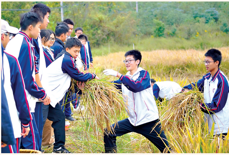
华中师大一附中2025高二年级的劳动实践课，让学生收获满满。