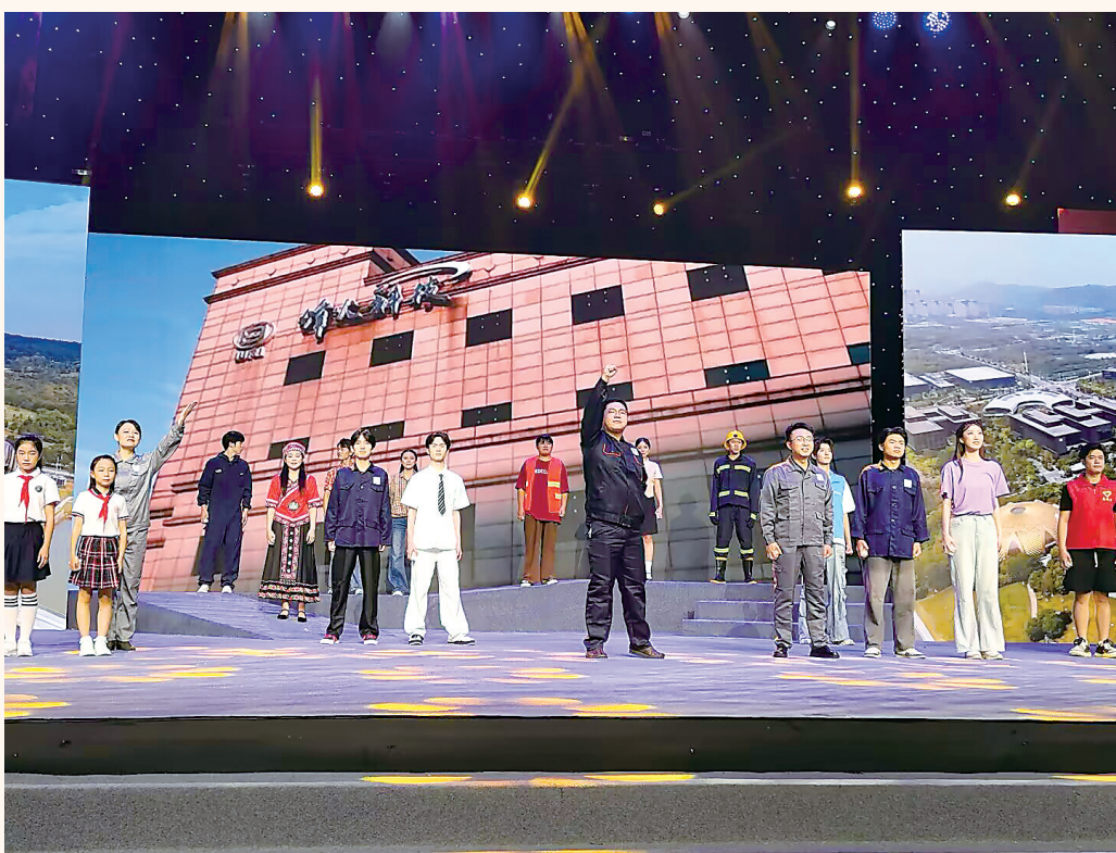
2025年武汉市“同上一堂思政课”现场。