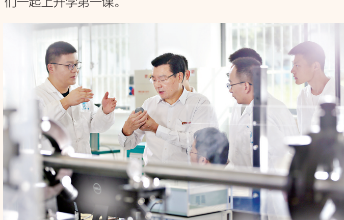
中国工程院院士、精细爆破全国重点实验室主任、江汉大学谢先启教授带队开展科研攻关。