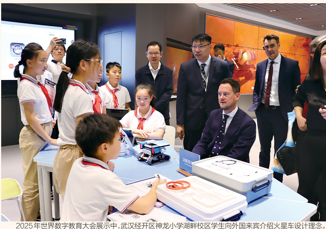
2025年世界数字教育大会展示中，武汉经开区神龙小学湖锦校区学生向外国来宾介绍火星车设计理念。