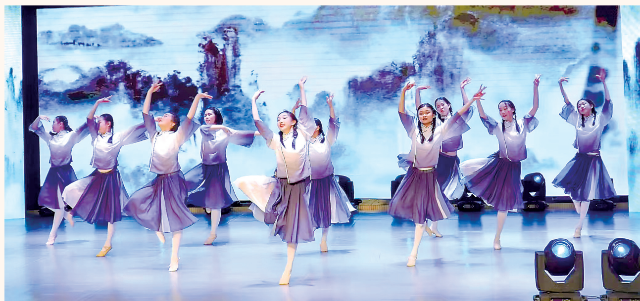
武汉市二中广雅中学舞蹈社团在武汉市艺术节比赛中荣获一等奖。