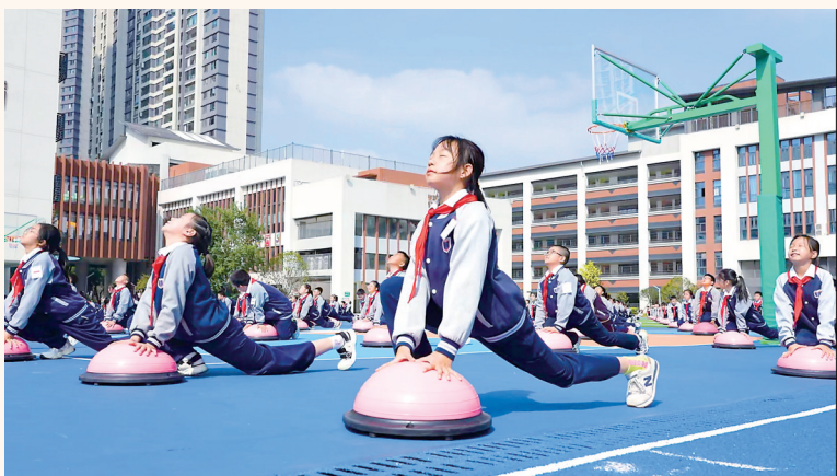
汉阳钟家村小学大课间。