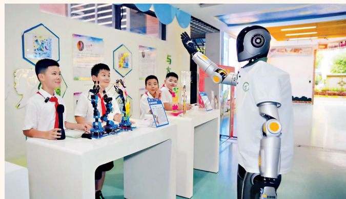
2025年9月1日，武汉市光谷第十五小学，AI机器人和孩子们一起上开学第一课。