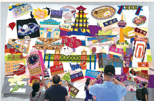
2025年“梦绘江城，美润童心”武汉市中小學生艺术展上，孩子们的作品亮眼。