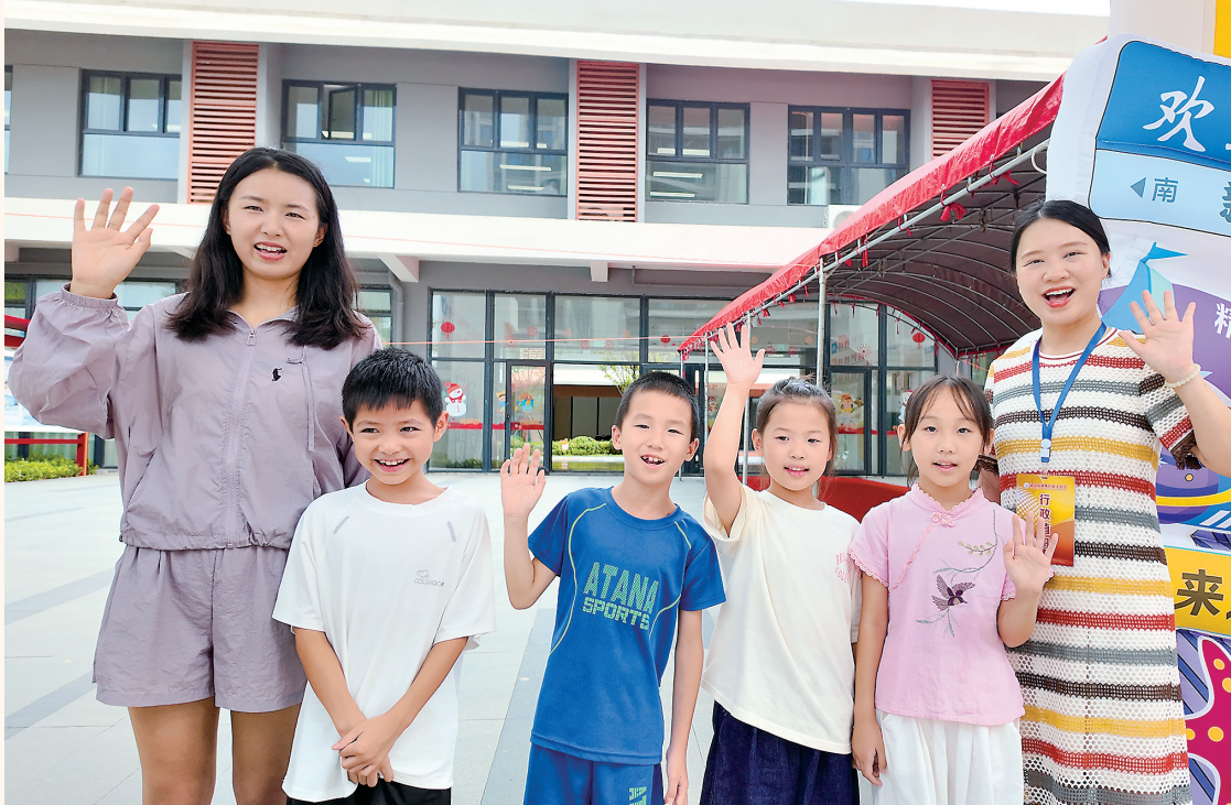
今年8月31日，武汉育才小学日露分校师生迎来新学期。该校为武汉首批跨区域集团办学10所分校之一。