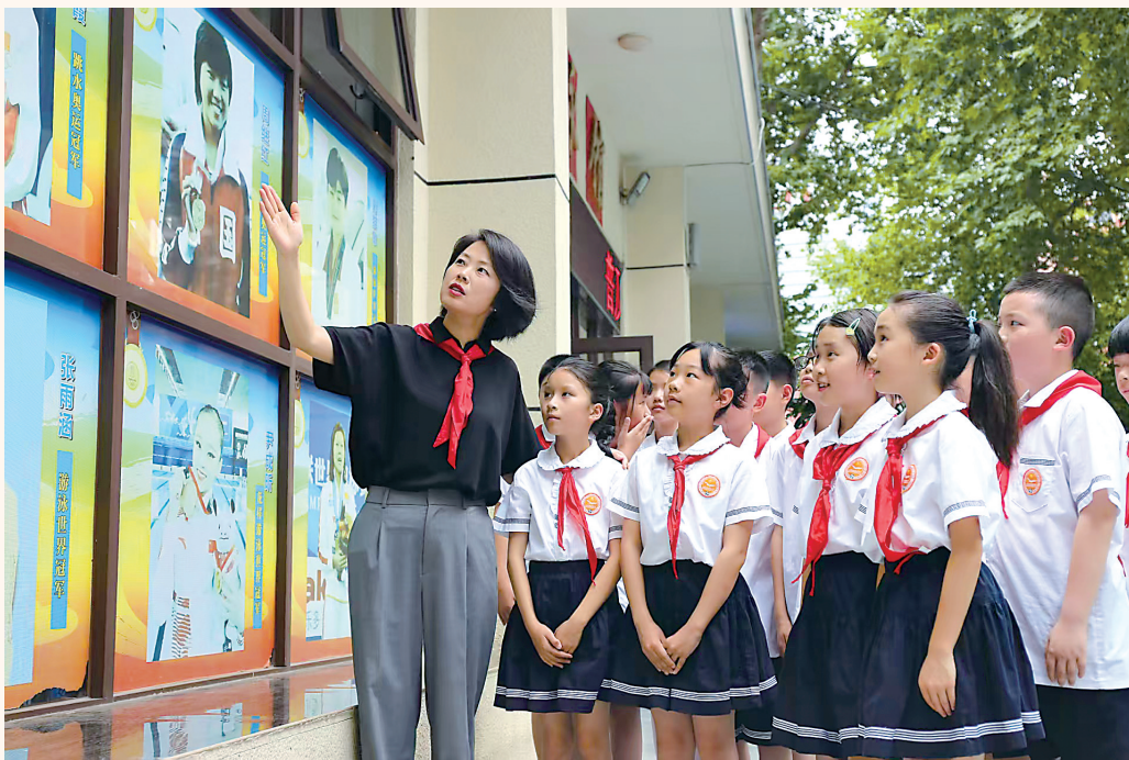
冠军文化墙前，硚口区山鹰小学师生“同上一堂思政课”，弘扬奥运精神。