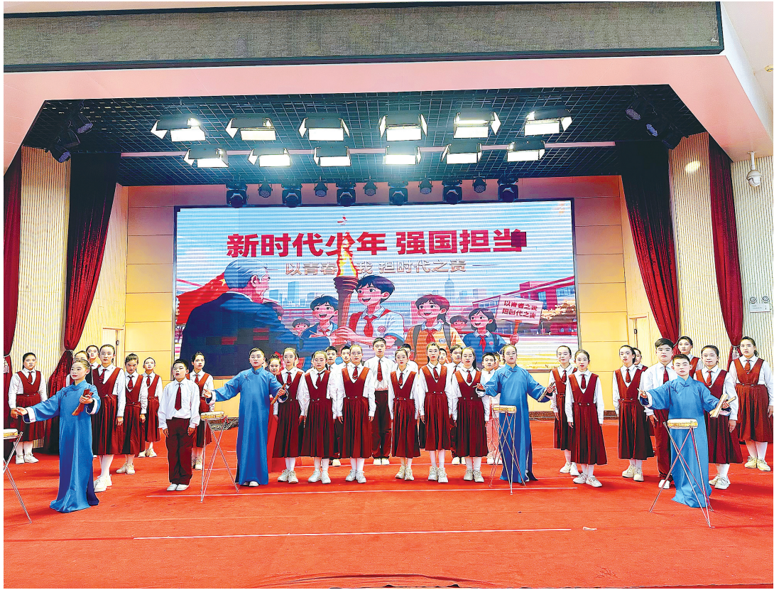
临空小学湖北大鼓社团学生登台表演。

学校根据气候变化动态调整大课间项目：冬季开展室内韵律操、桌面拉伸；夏季组织乒乓球挑战