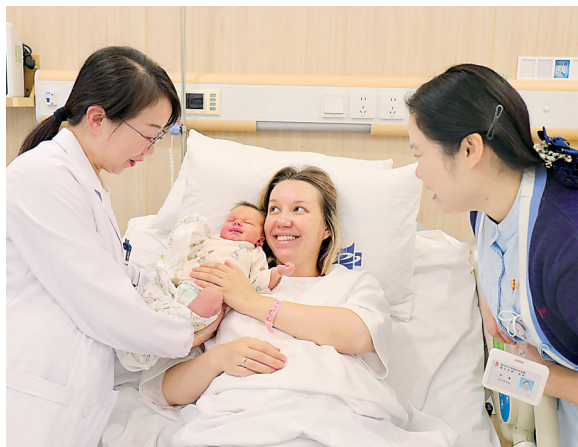
外籍女士在武汉市第一医院一体化产房顺利分娩后,点赞诊疗体验专业而温暖。