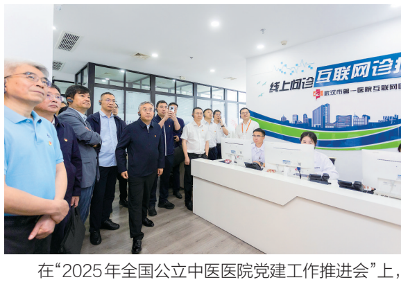
在“2025年全国公立中医医院党建工作推进会”上,与会代表调研参观该院智慧医院建设相关内容。