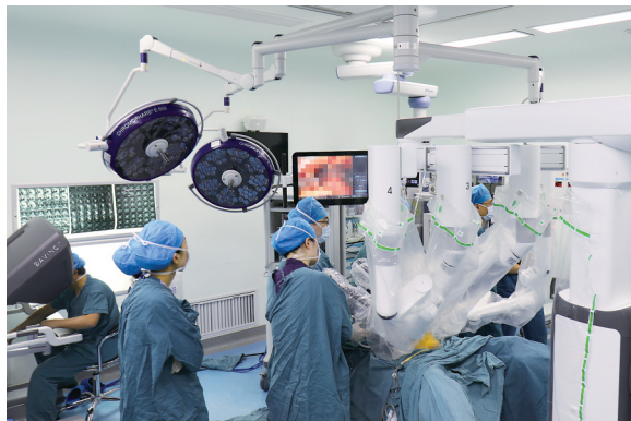
截至目前,该院成功应用第四代达·芬奇机器人完成超精准智能微创手术超500台次。