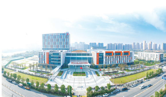
“十四五”期间,武汉市第一医院(武汉市中西医结合医院)新建盘龙城院区,惠及周边百万居民,逐步成为汉口北区域医疗中心。