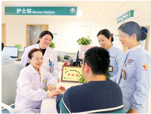
从挂号、缴费到门诊、病房,该院各党总支(支部)、科室相继创建了45个党建子品牌,设立了50个温暖示范岗。